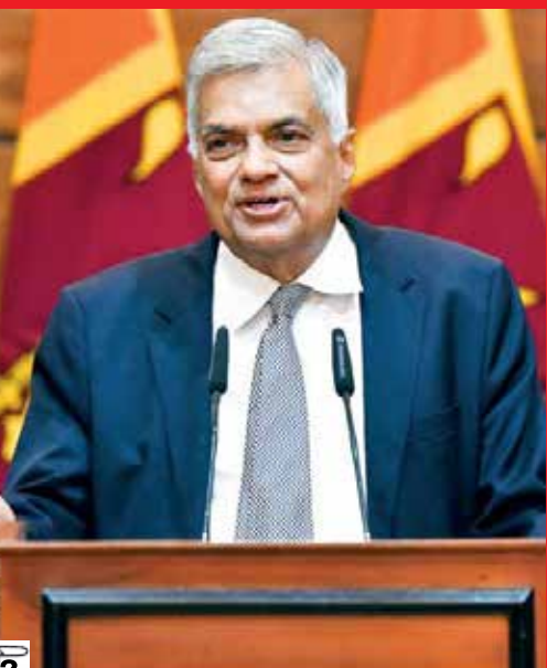
அடுத்த வருடம் ஜனவரி மாதம் ஜனாதிபதித் தேர்தலை நடத்துவதற்கான ஏற்பாட்டை அரசு செய்து வருகின்றது என அரசு உயர்மட்டத் தகவல்கள் தெரிவிக்கின்றன.