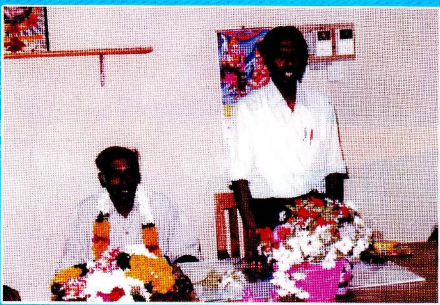
வலி வடக்கு பிரதேச சபையின் செயலாளராக பணியாற்றி ஓய்வு பெற்ற வேளை இடம்பெற்ற பாராட்டுவிழாவில் (1999)