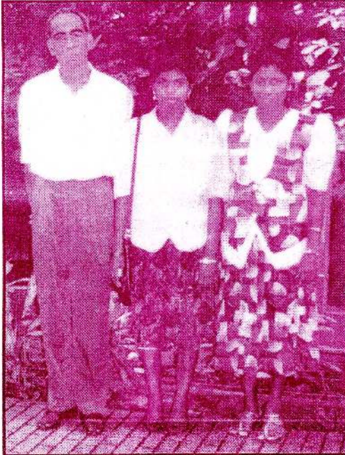
சிங்கப்பூரில் பெறாமக்களுடன் அமரர்...