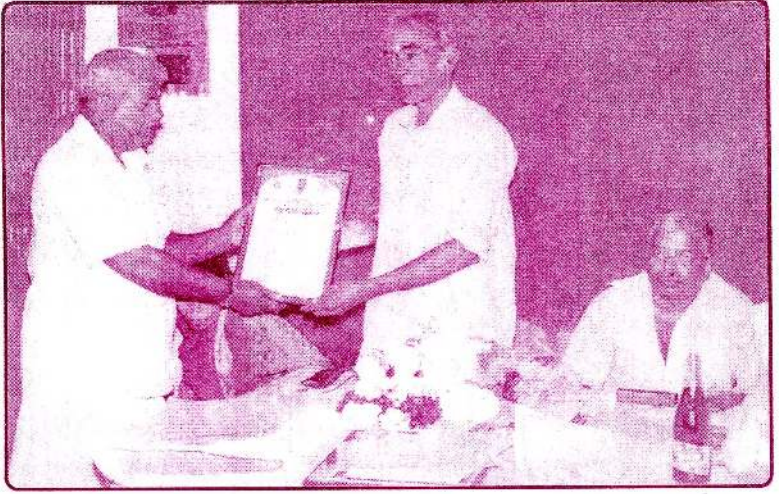
அமரரின் ஐம்பது வருட சமய சமூக சேவையைக் கௌரவித்து மயிலிட்டி வாழ் மக்கள் வழங்கிய பாராட்டுப் பத்திரம்.