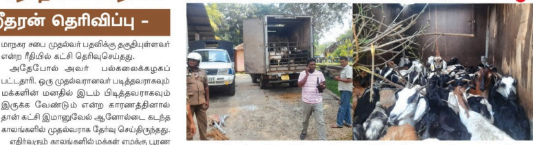
(கத்தளம் திருவா) கத்தளம் பொலிஸ் பிரிவுக்குட்பட்ட

சுமகல பொருளாதார நெருக்கடிக்குத் தீர்வுக்கான குழுவின்கள் மூவரும் குகமக ஜனாதிபதி மாதம் 13ஆம் திகதி ஜனாதிபதியின் செயலாளர் தலைமையில் விசேட கலந்துரையாடலொன்று ஜனாதிபதி செயலகத்தில் இடம்பெற்றது.