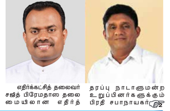
எதிர்க்கட்சித் தலைவர் சஜித் பிரேமதாஸ் தலைமையிலான எதிர் தரப்பு நாடாளுமன்ற உறுப்பினர்களுக்கும் பிரதி சபாநாயகர்