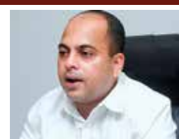
எஸ்.எம்.மரிக்கார் தெரிவித்தார். நாடாளுமன்றத்தில் நேற்று (வியாழக்கிழமை) இடம்பெற்ற சர்வஜன வாக்குரிமை தொடர்பான

எஸ்.எம்.மரிக்கார் எச்சரிக்கை முன்னாள் ஜனாதிபதி மைத்திரிபால சிறிசேனவின் நிலையைக் கருத்திற் கொண்டு அரசு அதிகாரிகள் உயர்நீதிமன்றத்தின் கட்டளைக்கு அமைய செயற்பட வேண்டும். நீதிமன்ற உத்தரவைப் புறக்கணித்து ஜனாதிபதியின் கட்டளைக்கு அமைய செயற்படும் அரசு அதிகாரிகள் எதிர் காலத்தில் சிறைசெல்லவேண்டும் என ஜக்கிய மக்கள் சக்திபிந்தாபுரம் என்ற பி