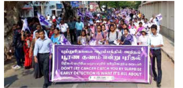
நடைபவனி-இதில் கல்லூரி மாணவர்கள், பழைய மாணவர்கள், வைத்தியசாலைச் சமூகத்தினர், நலன்விரும்பிகள் என பலரும் பங்கேற்றனர். (அ)

நடைபவனி யாழ்ப்பாணம் பரியோவான் கல்லூரியில் இருந்து ஆரம்பிக்கப்பட்டு பிரதான வீதி ஊடாக யாழ். போதனா வைத்தியசாலையை வந்தடைந்து மீண்டும் பரியோவான் கல்லூரியைச் சென்