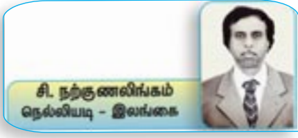
சி. நந்தனாரவர்கள் நெல்வியடி - இலங்கை

அவதானம் என்பது உய்த்துணர்வு, கூர்மையாகக் கவனித்தல். இது ஒரு மேன்மைச் செயல். தமிழ்க் கலைகளில் அவதானக் கலை என்பது ஓர் அற்புதக் கலை. அவதானமென்பது, ஒரு கலையை அல்லது செய்தியைக் கிரகித்தல், சாதாரியம், நிதானம், திறமைக்கு வித்தாதல் பண்புகளைப் பெற்று ஒரு சுவாலை, காரியத்தை செய்து முடித்தல் என்பவையே. பல வெவ்வேறு விடயங்களை கவனத்தில் கொண்டு அவற்றில் தேவையானவற்றை நினைத்தமாதிரித்தில் வெளிக்கொண்டு வருகின்ற திறமையை அவதானித்தல் எனலாம். அவதானித்தல் என்றால் மனக்குவிப்புச் செய்து விடயங்களைக் கிரகித்துக் கொள்வதாகும். அவதானிப்பு என்பது அறிவியல் நடைமுறை ஒன்றின் ஆரம்பச்செயற்பாடு ஆகும். அவதானிப்பு பண்புசார் தன்மை கொண்டதாக அல்லது அளவுசார் தன்மையதாக இருக்கும். அவதானங்களை எட்டு வகையான அட்டவதானம், பத்து வகையான தசாவதானம், பதினாறு வகையான சோடசாவதானம், நூறு வகை அவதானங்களைக் கொண்ட சதாவதானம் என வகைப்படுத்தலாம். அவதானத்தின் முக்கியத்துவம் உணரப்படாது, அவதானம் என்பது அருகியே விட்டது. இது குடும்பத்துக்கு மட்டுமல்ல, சமூகத்துக்கும், நாட்டுக்கும் கூட மிக அவசியமானது. இதை தொலைத்துவிட்டு அவதிப்படுவோர் பலர்.