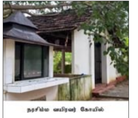
நரசிம்ம ஸ்வரவஜ் கோயில்

மாகத் தீர்த்து ஒன்றுபட்டுச் செயற்படுவோம். விழுந்தாலும் மீண்டும் எழுந்து நிற்போம், எங்கள் அடையாளங்களைக் கட்டி எழுப்புவோம் என்பதைச் செய்கையில் காட்டுவோம். எமது மிகுதி நிலங்களையும் மீட்டெடுப்போம். மக்களும், காலமும் தான் இதற்குப் பதில் சொல்ல வேண்டும்.