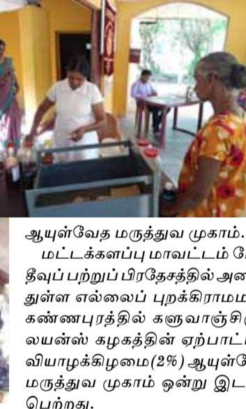
ஆயுள்வேத மருத்துவ முகாம். இடம்பெற்ற போதேயும் பிறதேசத்தில் அமைந்துள்ள எல்லைப் புறக்கிராமமான கண்ணபுரத்தில் களுவாஞ்சிகுடி லயன்ஸ் கழகத்தின் ஏற்பாட்டில் வியாழக்கிழமை (2%) ஆயுள்வேத மருத்துவ முகாம் ஒன்று இடம்பெற்றது.