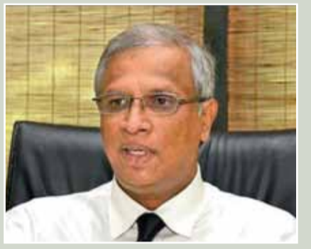
நிறைவேற்றுவதாக உறுதியளிக்கப்பட்ட எந்தவொரு விடயமும் நிறைவேற்றப்படவில்லை என ஜனாதிபதி ரணில்

நாடாளுமன்ற உறுப்பினருமான எம்.ஏ.சுமந்திரன்