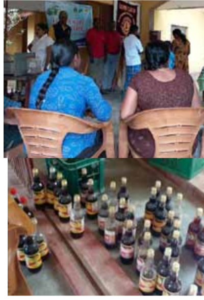
(ரக்ஸனா) களுவாஞ்சிகுடி லயன்ஸ் கழகத்தின் ஏற்பாட்டில் இடம்பெற்ற