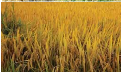
நெமடோடா தக்கத்தினை கட்டுபடுத்துவ

தற்கான நடவடிக்கையாக வயல் வரவைகள் ஒவ்வேன்றிற்கும் தனித்தனியாக நீர் பாச்சப்படல் வேண்டும். ஒரு வயலுக்குள் பாவித்த உபகரணங்களை அடுத்த வயலுக்கு பாவிக்கும் போது சுத்தப்படுத்தி பாவிப்பது நல்லது தாக்கம் அதிகரிப்பின் நெமடோடா நாசினியான எபமெக்ஸினை பாவிக்கலாம் ஒரு ஹெக்டேயருக்கு 50 கிலோக்கிராம் இடல் வேண்டும் வயலில் ஒரு செ.மீ நீரை தேக்கிவைத்து இட்டு மூன்று தொடக்கம் ஐந்து நாட்கள் இருப்பது அவசியமாகும் மட்டக்களப்பு மாவட்டத்தில் பெரும் போக விவசாயத்தில் 1% 9500 ஏக்கர்கள் விவசாயம் செய்யப்பட்டுள்ளதாகவும் தற்போது ஏற்பட்டுள்ள நோய்தாக்கத்திற்கு 62000 ஏக்கர் பாதிக்கப்பட்டுள்ளதாகவும் அதற்கு மேலதிகமாக கிழக்கு பல்கலைக்கழக விவசாய ஆராய்ச்சி பீடத்தினர் 10 வீதமான பாதிப்புத்தான் மட்டக்களப்பில் ஏற்பட்டுள்ளதாக குறிப்பிட்டுள்ளனர். எது எவ்வாறாயினும் விவசாயிகள் அவதானமாக செயற்படவேண்டுமென தெரிவிக்கப்பட்டுள்ளது.