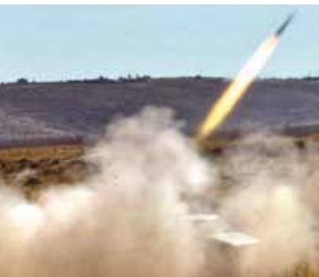
ஈடுபட்டு வருகிறது. சிரியாவில் அதிபா பா அல்-அசாதின் அரசுப் படையினருக்கு ஆதரவாக ஹிஸ் டுல்லா அமைப்பு சண்டையிட்டு வருகிறது.

சிரியாவின் மேற்கு நகரம் ஒன்றில் இஸ்ரேல் ஏவுகணைத் தாக்குதல் நடத்தியது. இதில் சிரியா அரசுப் படையினர் மூவா காயமடைந்தனர். இது குறித்து சிரியா அரசு செய்தி நிறுவனமான 'சனா' தெரிவித்திருப்பதாவது: ஹமா மாகாணம், மசையஃப் நகரம் மீது இஸ்ரேல் படையினர் ஞாயிறுக்கிழமை ஏவுகணைத் தாக்குதல் நடத்தியது. இதில் அரசுப் படையினர் மூவா காயமடைந்தனர். பல ஏவுகணைகளை சிரியாவின் வான் பாதுகாப்பு அமைப்பு சுட்டு வீழ்த்தியது எனத் தெரிவித்துள்ளது. இது குறித்து இஸ்ரேல் தரப்பில் எந்தக் கருத்தும் தெரிவிக்கப்படவில்லை. ஈரான் ஆதரவு பெற்ற சிரியா அரசுப் படையினரைக் குறிப்பிட்டு இஸ்ரேல் நீண்ட காலமாக தாக்குதலில்