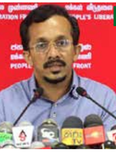
டொலருக்கு நிகராக இலங்கை ரூபாவின் பெறுமதி உயர்வதாகக் கூறுகின்றமை