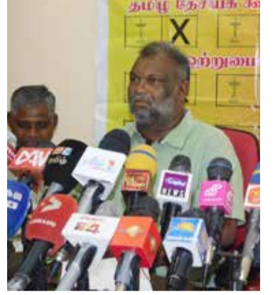
கால விளைவுகள் பாரதூரமாக இருக்கும். கடந்த காலங்களில் தமிழ் மக்களின் அகிம்சை ரீதியான போராட்டங்களை இரும்புக் கரம் கொண்டு அடக்கிய காரணத்தினாலேயே ஆயுதப் போராட்டம் வெடித்தது. அவ்வாறானதொரு நிலைமைக்கு மீண்டும் இந்த நாட்டை அரசு கொண்டு செல்லக்கூடாது என்பது எமது பணிவான வேண்டுகோள்-என்றார். (அ)

தற்போது நாட்டில் ஜனநாயகப் போராட்டங்கள் வெடித்துக் கொண்டிருக்கின்றன. அரசியற் கட்சிகள், பல்கலைக்கழக மாணவர்கள், தொழிற்சங்கங்கள் எனப் பல்வேறு தரப்பினரால் போராட்டங்கள் முன்னெடுக்கப்பட்டு வருகின்றன. இந்தப் போராட்டங்களை இரும்புக் கரம் கொண்டு அரசு அடக்கிக் கொண்டு வருகின்றது. இந்தப் போராட்டங்களை கடுமையாக அடக்கினால் எதிர்