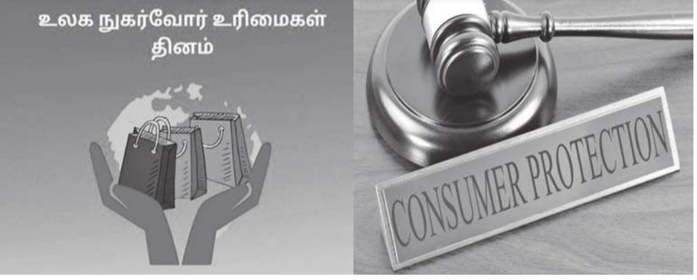
உலக நுகர்வோர் உரிமைகள் தினம்