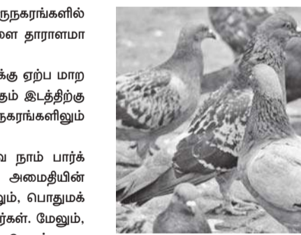
மேலும், செல்லப்பிராணிகள் கடையில் வேலை செய்வோர், கோழிப் பண்ணைகளில் வேலை செய்வோர், தொடர்ச்சியாகப் புறாக்களுக்கு உணவளிப்போருக்கு இந்தப் பாதிப்பு அதிகம் ஏற்படுகிறது.

பறவைகளுக்கு உணவு அளிப்பது நல்லதுதான். ஆனால், புறாக்களுக்கு நமது இருப்பிடத்திற்கு அருகிலேயே வைத்து உணவு கொடுப்பது நமது நுரையீரலை விவரவில் பாதிக்கலாம். இது 'ஹைப்ரென்சிடீடல் நிமோனியா' பாதிப்பை ஏற்படுத்துவதாக மருத்துவர்கள் தெரிவிக்கின்றனர். உலகில் பெரும்பாலான இடங்களில் நம்மால் புறாக்களை எளிதாகப் பரக்க முடியும். பெருநகரங்களில் காத்ததைப் பார்ப்பது கூட அரிது. ஆனால், புறாக்களை தராளமாகப் பரக்கலாம்.