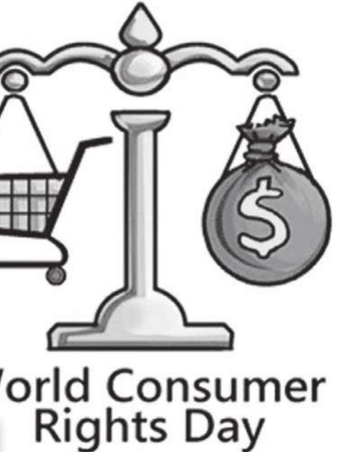
World Consumer Rights Day

வதை கட்டாயப்படுத்துவதன் மூலம் மோசடிகள் மற்றும் ஏமாற்றங்களிலிருந்து பாவனையாளர்களைப் பாதுகாக்க முடியும். இது தொடர்பாக பாவனையாளர் அலுவலகம் அதிகார சபை கவனம் எடுத்து ஆவன செய்ய முன்வர வேண்டும். பாவனையாளர் அலுவலகம் அதிகார சபை சட்டத்தின் முன் குற்றமாக காணப்படும் செயற்பாடுகளில் சில வருமாறு: விலைப்படியை நுகர்வோரின் பார்