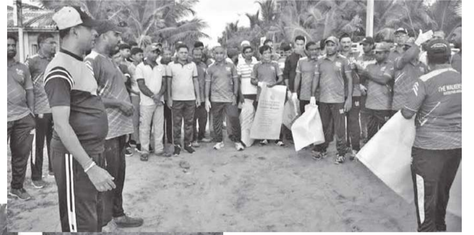
சமூக ஆர்வலர்களால் சிரமதான துப்புரவுப் பணிகள்

எதிர்காலத்தில் கிரமமாக நடைமுறைப்படுத்தப்பட வேண்டும் என்பதே அனைவரினதும் எதிர் பார்ப்பாறும். அப்பாறை மாவட்டத்தில் பொதுமக்கள் ஓய்வு மற்றும் பொழுதுபோக்கிற்காக பயன்படுத்தும் பொதுஇடங்கள் அதிகமுள்ளன. இவ்வாறான பொதுஇடங்கள் நீண்ட காலம் சத்தம் செய்யப்படாது, கவனிப்பாற்ற நிலையில் இருப்பதை காரணக் கூடியதாக உள்ளது. கடற்கரைப் பிரதேசங்களை உல்லாசம், பொழுதுபோக்கிற்கு பயன்படுத்துவதைத் தவிர, போதைப்பொருள் பாவனைக்கு இரவு நேரங்களில் பயன்படுத்துபவர்கள் தொகையும் அதிக