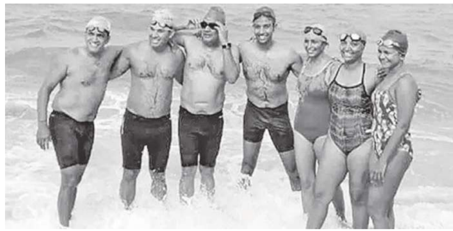
மணிக்கு தனுஷ்கோடி அரிச்சல்முனை கடற்கரை வந்தடைந்து தங்கள் நீச்சல் சாதனை பயணத்தை நிறைவு செய்தனர். தலைமன்னார் அருகே உள்ள கடல் பகுதியில் இருந்து

இலங்கையின் தலைமன்னார் அருகே உள்ள கடல் பகுதியில் இருந்து தமிழ்நாட்டின் தனுஷ்கோடி அரிச்சல்முனை வரை சுமார் 23 கிலோ மீட்டர் தூர பயணத்தை 10 மணி நேரம் 45 நிமிடத்தில் கடந்து ஏழு பேர் சாதனை படைத்துள்ளனர். ஒரு வீரர் நீந்தி முடிக்கும் இடத்தில் இருந்து மற்றொரு வீரர் மீண்டும் நீந்தும் வகையிலான நீச்சல் பயிற்சியில் நீந்தி இந்தக் குழுவினர் தனுஷ்கோடி வரை நீந்தி சென்றுள்ளனர். கர்நாடக மாநிலத்தைச் சேர்ந்த 7 பேர் கடந்த சூரியன்று இராமேஸ்வரத்தில் இருந்து விசைப்படகு ஒன்றில் இலங்கை தலைமன்னார் நோக்கி புறப்பட்டு சென்றனர். இவர்களுக்கு உதவியாக அந்த படகில் நீச்சல் பயிற்சியாளர் மற்றும் மீனவர்கள் உள்ளிட்ட 9 பேரும் சென்றனர். இந்த நிலையில் தலைமன்னார் அருகே உள்ள கடல் பகுதியில் இருந்து நேற்றுமுன்தினம் அதிகாலை 5 மணிக்கு கர்நாடக மாநிலத்தைச் சேர்ந்த 4 ஆண்கள் மற்றும் 3 பெண்களும் தனுஷ்கோடி நோக்கி நீந்தத் தொடங்கினர். கடலில் நீந்தத் தொடங்கிய இந்தக் குழுவினர் நேற்றுமுன்தினம் மாலை 3.45