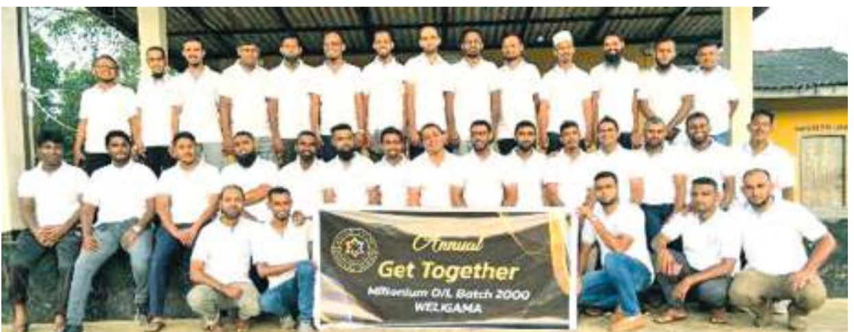
வெலிகம அறபா மத்திய கல்லூரியில் (தேசிய பாடசாலை) 2000 ம் ஆண்டு க.பொ.த சாதாரண தர வகுப்பில் ஒன்றாக கற்ற மாணவர்களின் ஒன்று கூடல் ஹம்பாந்தோட்டை 'கொஹம்பவிலி' இல்லத்தில் அண்மையில் நடைபெற்றது. சுமார் 23 வருடங்க ளுக்குப் பின்னர் ஒன்று கூடிய இம் மாணவர்களுள் வெளியூர் மாணவர்களும் கலந்து கொண்டனர். இவர்கள் அனைவரும் இன்று பல்வேறு துறைகளில் ஈடுபட்டு வருகின்றனர். இந்த ஒன்று கூடல் மூலமாக கற்ற பாடசாலையின் முன்னேற்றத்துக்கு எதிர்காலத்தில் தேவையான உதவிகளை செய்ய இதன்போது உறுதிபுண்டனர்.