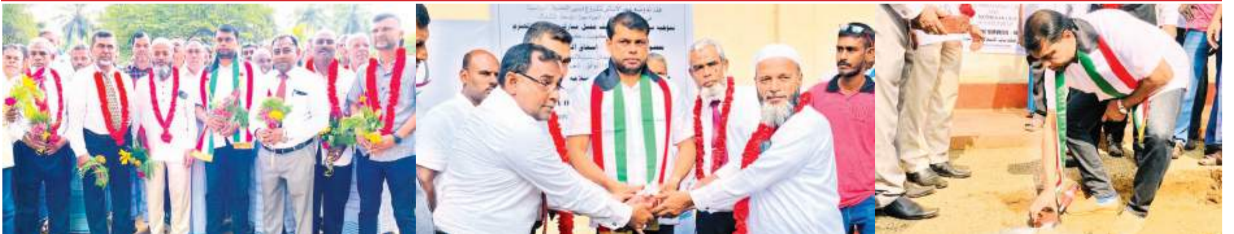
குவைத் பரோபகாரிக்கு பாடசாலை சமூகம் பாராட்டு இஷாக் எம்.பி., அல் ஹிமா பணிப்பாளர் பங்கேற்பு

கெக்கிராவ குறூப், அனூராதபுரம் மேற்கு அனூராதபுரம் மாவட்டம், சுப்பிரி கல்வெவ மனாரூல் உலூம் மகா வித்