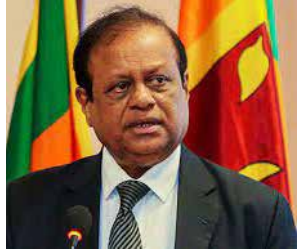
பாடசாலை மாணவர்களுக்கான மதிய உணவு வழங்கும் தேசிய வேலைத்திட்டத்தை

இரட்டிப்பாக்கவுள்ளதாக கல்வி அமைச்சர் சூசில் பிரேமஜயந்த தெரிவித்துள்ளார்.