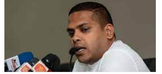
கூட்டத்தில் கலந்துரையாடப்படவில்லை என்று அமைச்சர் பந்துல குணவர்தன தெரிவித்தார்.

அதேவேளை, அமைச்சரவை மறுசீரமைப்பு குறித்து நேற்றைய அமைச்சரவைக்