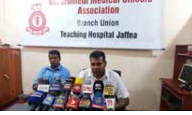
அரச வைத்திய அதிகாரிகள் சங்கத்தினரும் சில கோரிக்கைகளை முன்வைத்து தொழிற்சங்க நடவடிக்கையில் ஈடுபட்டுள்ளனர்.

குறிப்பாக அரசின் நியாயமற்ற வாரிசுகளை, சம்பளக் குறைப்பு, மருந்துத் தட்டுப்பாடு உள்ளிட்ட பிரச்சினைகளுக்கு அரசு உடனடியாகத் தீர்வை வழங்க வேண்டுமென வலியுறுத்தி கடந்த காலங்களில் போராட்டங்களை முன்னெடுத்திருந்தோம்.