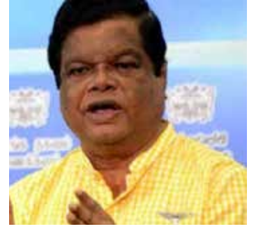
வேண்டியது தேர்தலையாகும். ஆனால் நீதி நெருக்கடிகளுக்கு அரசியல் ரீதியில் எந்தவொரு தீர்வையும் வழங்க முடியாது. - என்றார்.

கூறியதைப் போன்றே முதலில் வாக்களித்த ஜவர்கொல்லப்பட்டனர். இவ்வாறு தத்தமது அரசியல் தேவைகளுக்கமைய தேர்தலை நடத்துமாறும், நடத்த வேண்டாமெனவும் ஆர்பாட்டங்கள் நடத்தப்பட்ட வரலாறு எம் நாட்டில் காணப்படுகிறது. தற்போதுள்ள நெருக்கடிகளை தேர்தல் தீர்க்குமானால் முதலில் நடத்த