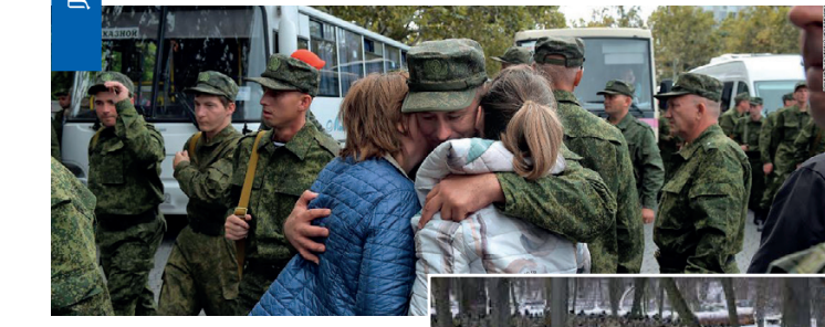
நேட்டோ படையுடன் உக்ரேன் இணைவதற்கு எதிர்ப்புத் தெரிவித்து, ரஷ்யா கடந்த ஒருவருடமமாக உக்ரேன் மீது தாக்குதல் நடத்தி வருகின்றது.

இப்போரில் இரு தரப்பில் இருந்தும் ஆயிரக்கணக்கான வீரர்கள் உயிரிழந்துள்ள நிலையில், உக்ரேனுக்காக நாட்டில் உள்ள தகுதியான ஆண்கள் அனைவரும் நிச்சயமாக போர் புரியவேண்டும் எனவும் அதற்கான பயிற்சிகள் முறையாக வழங்கப்படும் எனவும் புட்டின் அதற்கான பயிற்சிகள் முறையாக வழங்கப்படும் எனவும் புட்டின் தலைமையிலான ரஷ்ய அரசு தெரிவித்திருந்தது. இந்நிலையில், தங்களது