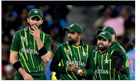
ஆப்கானிஸ்தானுக்கு எதிரான தொடரில்

இந்தியாவுக்கெதிரான ஒருநாள் சர்வதேசப் போட்டித் தொடரில் அவஸ்திரேலியாவுக்கு ஸ்டீவ் ஸ்மித் தலைமை தாங்கவுள்ளார். அணித்தலைவர் பர் கமின்ஸின் தாயர் கடந்த வாரம் இறந்தமையையடுத்து அவர் தொடர்ந்தும் அவஸ்திரேலியாவிலுள்ள நிலையிலேயே ஸ்மித் அவஸ்திரேலியாவுக்கு தலைமை தாங்கவுள்ளார். குழாமில் கமின்ஸை எவரைக் கொண்டும் பிரதிமீட்டவில்லை.