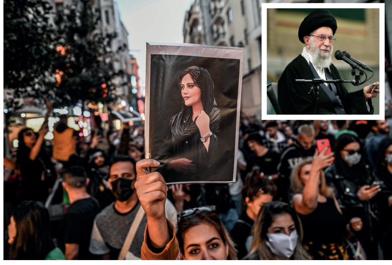
ஈரான் பொலிஸாரால் கைதுசெய்யப்பட்டனர். இந்தநிலையில் அந்நாட்டு நீதித்துறை தலைவர் விடுத்துள்ள அறிக்கையில், அடுத்த வாரம் ரம்ஜான் நோன்பு தொடங்க

இதனையடுத்து போராட்டங்களில் ஈடுபட்ட ஆயிரக்கணக்கானோர்