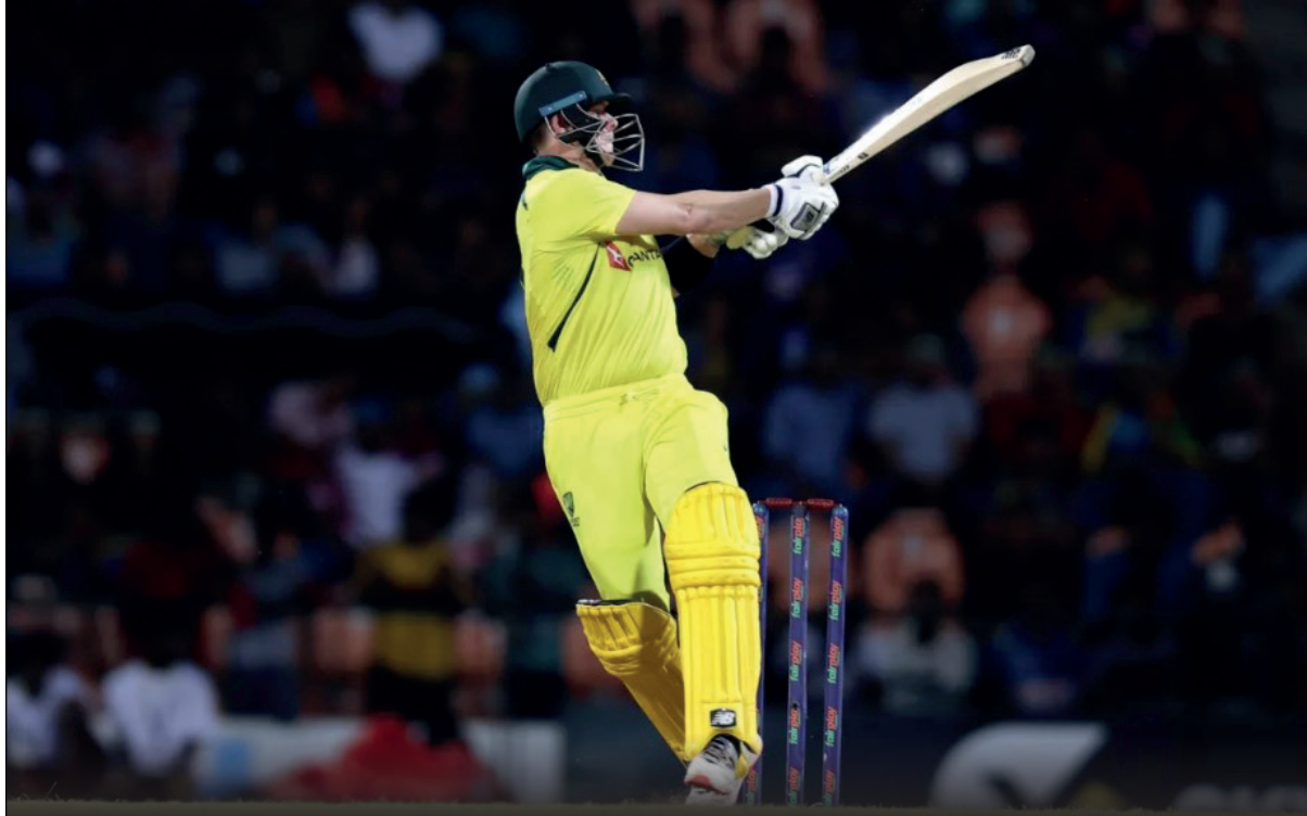
இந்தியாவுக்கெதிரான ஒருநாள் சர்வதேசப் போட்டித் தொடரில்