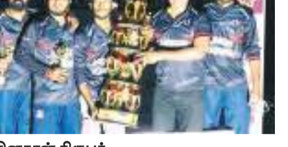
அனூராதபுரம் மேற்கு தினகரன் நிருபர்