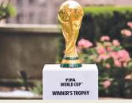
வாய்க்கிழமை நடைபெற்ற பிஃபா குழுக் கூட்டத்தில் இதற்கான ஒப்புதல் வழங்கப்பட்டது. அடுத்த உலகக் கிண்ணம் அமெரிக்காவில் 11, மெக்ஸிகோவில் மூன்று மற்றும் கனடாவின் இரண்டு என மொத்தம் 16 நகரங்களில் நடைபெறவுள்ளன.

2026 பிஃபா உலகக் கிண்ணத்தில் மொத்த போட்டிகளின் எண்ணிக்கை 64இல் இருந்து 104ஆக அதிகரிக்கப்பட்டுள்ளதாக சர்வதேச காஸ்பந்து சம்மேளம் அறிவித்துள்ளது. அமெரிக்கா, மெக்ஸிகோ மற்றும் கனடா நாடுகள் இணைந்து நடத்தும் போட்டியில் பக்கேற்கவுள்ள அணிகளின் எண்ணிக்கை 32 இல் இருந்து 48ஆக அதிகரிக்கப்பட்டிருக்கும் நிலையில் நான்கு அணிகளைக் கொண்ட 12 குழுக்களில் ஆரம்ப சுற்றுப் போட்டிகள் நடத்தப்படவுள்ளன. இதில் புதிதாக 32 அணிகள் கொண்ட சுற்று ஒன்று அறிமுகப்படுத்தப்பட்டுள்ளது. இதற்கு ஒவ்வொரு குழுவிலும் 16 முதல் இரு இடங்களை பிடிக்கும் அணிகளுடன் மூன்றாம்