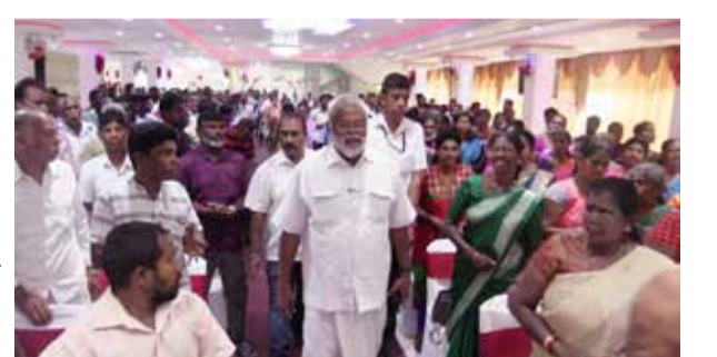
யிடும் வேட்பாளர்கள், கட்சியின் முக்கியஸ்தர்கள் என பலர் கலந்து கொண்டிருந்தனர். (ஐ)

இதன்போது யாழ்ப்பாணம் மாவட்டத்தின் உள்ள உள்ளூராட்சி மன்றங்களில் ஈழ மக்கள் ஜனநாயக கட்சியின் சார்பில் போட்டி