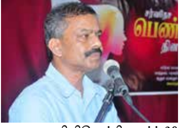
கிளிநொச்சி, மார்ச் 20