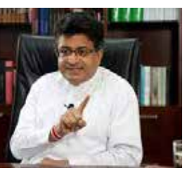
வாங்கியதால் தான் ஏற்பட்டது. இந்த நிலையில் தற்போது ஜனாதிபதியாக இருக்கும் ரணில் விக்கிரமசிங்க நாட்டை மீட்டெடுப்பதற்காக சர்வதேச நாணய நிதியத்தினை நாடியுள்ளேன் என்று தெரிவிக்கிறார். அவர் சர்வதேச நாணய நிதியத்திடமும் கடன்தான் பெற்றுக்கொள்ளுகின்றார். நிதியம் 2.9 பில்லியன் டொலர்களை இலங்கைக்கு வழங்குகின்றது. ஆனால் மீள்

ஜனாதிபதி ரணில் விக்கிரமசிங்க நாட்டின் பொருளாதாரத்தினை மீட்டெடுக்கவில்லை. மாறாக ஒட்டுமொத்த நாட்டையும் சீழிக்கும்பெரும் கடன் வெறுகண்டையே உருவாக்கி வருகின்றார் என்று பிவித்திரு வெறு உறுமயவின் தலைவரும், நாடாளுமன்ற உறுப்பினருமான உதய கம்மன்பில தெரிவித்தார். டலஸ் அழகப்பெரும் தலைமையிலான சுதந்திர மக்கள் சபையின் மக்கள் சந்திப்புக் கூட்டமொன்று சனிக்கிழமை கண்டியில் நடைபெற்றது. அதில் கலந்துகொண்டு உரையாற்றும் போதே அவர் மேற்கண்டவாறு தெரிவித்தார். அவர் மேலும் தெரிவித்ததாவது: தற்போது நாட்டில் ஏற்பட்ட பொருளாதார நெருக்கடி யானது பெருமளவில் உணர்ச்சை