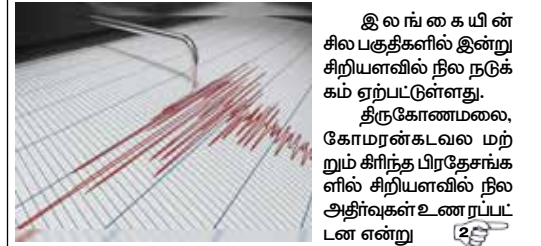
இலங்கையின் சில பகுதிகளில் இன்று சிறியளவில் நில நடுக்கம் ஏற்பட்டுள்ளது. திருகோணமலை, கோமரன்கடவல மற்றும் கிரீந்த பிரதேசங்களில் சிறியளவில் நில அதிர்வுகள் உணரப்பட்டன என்று