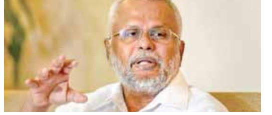
காணலாம் எனத் தொடங்கி தற்போது கணநாயக வழியில் அரசியல் தீர்வு முயற்சிகள் முன்னெடுக்கப்பட்டு வருகின்றன எனக் குறிப்பிட்டுள்ளார். இவ்வாறான நிலையில் யாழ்ப்பாணம் மற்றும் வன்முறைச் சம்பவங்களுக்கு முடிவு கட்ட பொதுமக்கள் ஒத்துழைப்பு அவசியம் என்றும் கூறியுள்ளார்.

யாழ்ப்பாணம், மார்ச் 18 யாழ்ப்பாணத்தில் போதைப் பொருள் பாவனை மற்றும் வன்முறைச்சம்பவங்களுக்கு முடிவுகட்டுவோம் என அமைச்சர் டக்ளஸ் தேவானந்தா தெரிவித்துள்ளார். சொங்குந்தா இந்துக் கல்லூரியில் இடம்பெற்ற நிகழ்வை அடுத்து உரையாற்றிய போதே கடற்றொழில் அமைச்சர் டக்ளஸ் தேவானந்தா இவ்வாறு கூறியுள்ளார். ஆயுதப் போராட்டத்தின் மூலம் தமிழ் மக்களுடைய பிரச்சினைகளுக்குத் தீர்வு