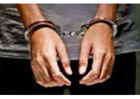
ஒரு வருடன் சென்றிருந்த போது கைது செய்யப்பட்டுள்ளார்.

ரவிந்து சங்க என்ற ஹைக்கப்படும் பூரு மூனா, நீதிமன்றத்தில் சரணடையச் சென்றபோது கைது செய்யப்பட்டுள்ளார். அவர், அவிசாவளை நீதிவான் நீதிமன்றத்துக்குச் சரணடையச் சென்றபோது, பொலிஸார் என்று தம்மை அடையாளப்படுத்திக்கொண்டவர்களால் கைது செய்யப்பட்டார். அண்மைக் காலமாக இடம்பெற்ற கொலைச் சம்பவங்களுக்காக அவர் தேடப்பட்டு வந்தார் எனக் கூறப்படும் அவிசாவளை நீதிவான் நீதிமன்றில் சரணடைவதற்காகச் சட்டத்தரணி