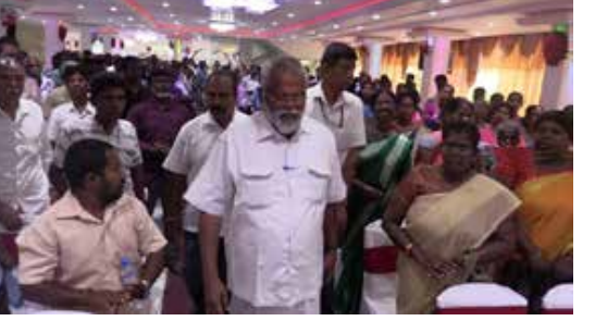
தின் உள்ள உள்ளூராட்சி மன்றங்களில் ஈழ மக்கள் ஜனநாயக கட்சியின் சார்பில் போட்டியிடும் வேட்பாளர்கள், கட்சியின் முக்கியஸ்தர்கள் எனப் பலர் கலந்து கொண்டிருந்த மை குறிப்பிடத்தக்கது.

உள்ளூராட்சி மன்றங்களின் பதவிக்காலம் தொடர்பாக ஈழ மக்கள் ஜனநாயக கட்சியின் செயலாளர் நாயகமும் கடற்புறாழில் அமைச்சருமான டக்ளஸ் தேவானந்தா ஊடகங்களுக்குத் தகவல் தெரிவித்துள்ளார். ஈழ மக்கள் ஜனநாயக கட்சியின் சார்பில் உள்ளூராட்சி மன்றத் தேர்தலில் போட்டியிடும் யாழ்ப்பாணம் மாவட்ட வேட்பாளர்களுடனான கலந்துரையாடல் ஒன்று அமைச்சர் டக்ளஸ் தேவானந்தாதலைமையில் நடைபெற்றது. இதன்போது, உள்ளூராட்சி மன்றங்களின் பதவிக்காலம் குடியேற்றக் கீழமை நள்ளிரவு நிறைவடைவது பற்றி ஊடகவியலாளர்களின் கேள்விக்குப் பதிலளித்த துடன், நீதி கிடைத்தால் எந்த நேரமும் தேர்தல் நடக்கலாம் எனவும் குறிப்பிட்டுள்ளார். இந்தக் கலந்துரையாடலில் யாழ்ப்பாண மாவட்ட