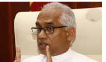
எதிர்க்கட்சி சமூக பொருளாதாரக் கொள்கையின் மீது நம்பிக்கை வைத்திருக்கிறது. சமூக பொருளாதாரக் கொள்கையை அரசாங்கம் பின்பற்றினால் நாம் அரசாங்கத்துக்கு ஆதரவளிக்கத்தயார். இந்த அரசாங்கம் உலக வங்கி, ஆசிய அபிவிருத்தி வங்கி உள்ளிட்ட இலங்கைக்கு நிதியளிக்கும் பல்வேறு குழுக்களுடனும் கலந்துரையாடல்களில் ஈடுபட்டிருக்கிறது.

தற்போதைய அரசாங்கத்தின் பொருளாதார கொள்கைகள் மக்களின் வாழ்க்கைக்கு பேரிடமாக அமைந்துள்ள நிலையில் அதற்கு ஆதரவளிப்பதால் நாம் நிராகரிக்கப்படுவோம். மேலும் மட்டத்தில் உள்ளவர்கள் தங்களைப் பாதுகாத்துக் கொள்வதற்கு அரசாங்கத்துக்கு ஆதரவுளிக்க மாறு எம்மீடம் கேட்கின்றனர். ஆனால் அனைத்து மக்களையும் மீட்டெடுக்கும் பொறுப்பு எமக்குள்ளது.