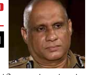
சந்தேகநபருக்கு சங்கடத்தை ஏற்படுத்துவதுடன் பொலிஸ் நடவடிக்கைகளுக்கு இடையூறாக அமையும் என்பதால், ஊடகங்களை சோதனை நடவடிக்கைகளின் போது அழைத்துச் செல்வதை நிரூபிப்பதற்கு பொலிஸ் தலைமையகம் உத்தரவிட்டுள்ளது.

சந்தேகநபரை விசாரணை செய்யும் விதம் ஊடகங்கள் ஊடக விளம்பரப்படுத்தப்படுவதால்,