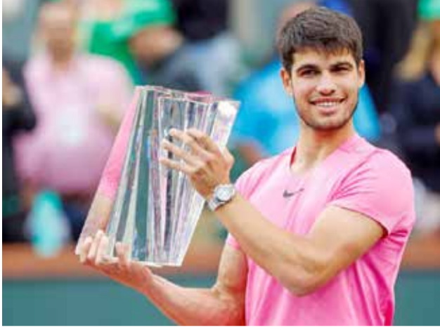
கலிபோர்னியா, மார்ச் 22

இந்தியன்வெல்ஸ் தொடரை கார்லோஸ் அல்கராஸ் கைப்பற்றினார்.