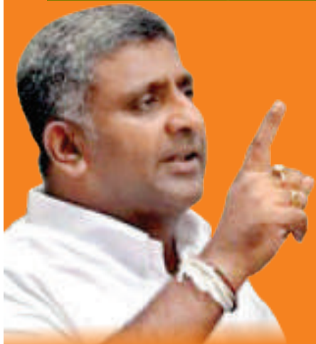
முன்னாள் பிரதமர் மஹிந்த ராஜபக்ஷவை