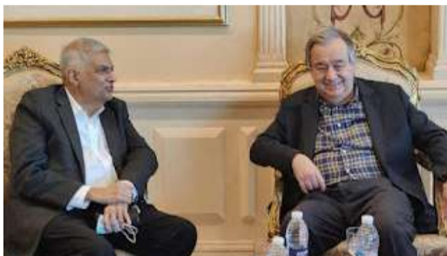
எகிப்தின் கெய்ரோவைச் சென்றடைந்த ஜனாதிபதி ரணில் விக்கிரமசிங்க அங்கே ஐக்கிய நாடுகள் சபையின் பொதுச் செயலாளர் அன்டோனியோ குட்டரொவை