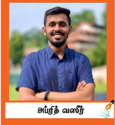
சர்வதேச கிரிக்கெட் பேரவை ஓவ்வொரு ஆண்டும் சர்வதேச போட்டிகளில் சிறப்பாக விளையாடி வரும் வீரர் மற்றும் வீராங்கனைகளை தெரிவு செய்து,

போட்டிகளிலும் (டெஸ்ட், ஒருநாள், T20) சேர்த்து 44 போட்டிகளில் ஆடிய அவர் 8 சதங்கள், 17 அரைச் சதங்கள் உட்பட 2,598 ஓட்டங்களைக் குவித்துள்ளார். இதன் மூலம் கடந்த ஆண்டில் 2 ஆயிரம் ஓட்டங்களுக்கு மேல் குவித்த ஒரே வீரராக இடம்பிடித்த பாபர் அசாமுக்கு ஐசிசியினால் 2022ஆம் ஆண்டிற்கான சிறந்த கிரிக்கெட் வீரர் விருது வழங்கி கௌரவிக்கப்பட்டுள்ளது. முன்னதாக, 2018 மற்றும் 2019 என தொடர்ந்து இரண்டு ஆண்டுகள் ஐசிசியின் சிறந்த கிரிக்கெட் வீரருக்கான விருதை இந்திய கிரிக்கெட் அணியின் முன்னாள் தலைவர் விராத் கோஹ்லி வென்ற நிலையில்,