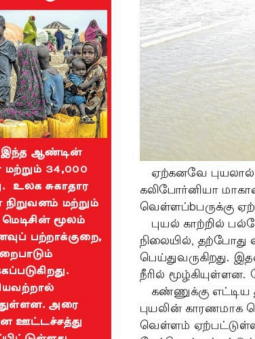
சோமாலியாவில் 40 ஆண்டுகளில் இல்லாதளவிற்கு நிலவும் கடும் பற்றாக்குறை கட்டை ஆண்டு மட்டும் 43,000 பேர் உயிரிழந்துள்ளதாக உலக சுகாதார அமைப்பு தகவல் தெரிவித்துள்ளது.

சோமாலியாவில் 40 ஆண்டுகளில் இல்லாதளவிற்கு நிலவும் கடும் பற்றாக்குறை கட்டை ஆண்டு மட்டும் 43,000 பேர் உயிரிழந்துள்ளதாக உலக சுகாதார அமைப்பு தகவல் தெரிவித்துள்ளது. ஆபிரிக்க தீவிரப்பத்தில் வறட்சியால் அதிகப்பெட்ட முதல் அதிகாரியுடன் இறப்பு எண்ணிக்கை இதுவாகும். இந்த ஆண்டின் முதல் ஆறு மாதங்களில் குறைந்தது 18,000 பேர் மற்றும் 34,000 பேர் உயிரிழக்கவேண்டும் என கணி்கப்பட்டுள்ளது. உலக சுகாதார அமைப்பு மற்றும் ஐக்கிய நாடுகளின் குழந்தைகள் நிறுவனம் மற்றும் வளர்ச்சி கூலம் ஒலி கைதீன் என்க் டிராபிகல் மெடிசின் குழாம் உள்ளிட்ட அறிவிக்கையில், வறட்சியால் உணவுப் பற்றாக்குறை, கொரோனா போன்ற சோமாலியா அட்டைசுத்து குறைபாடு ஏற்பட்டு இறப்பு விதிவற்ற அதிகரிப்பதால் தெரிவிக்கப்பட்டுள்ளது. சோமாலியா மாற்றம் பாதுகாப்பின்மை ஆகியவற்றால் பலவீனப்படுகின்றன காரணமாக உயிரிழந்துள்ளனர். ஆனால் மில்லியன் குழந்தைகள் இந்த ஆண்டு கொடுமையான அட்டைசுத்து குறைபாட்டால் பாதிக்கப்படுவார்கள் என்று குறிப்பிட்டுள்ளது.