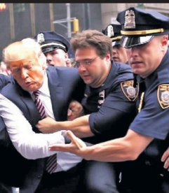
இணையத்தில் வைரலான ட்ரம்பின் போலி கைது படங்கள்

அமெரிக்காவில் 2017 ஆம் ஆண்டு முதல் 2021 ஆம் ஆண்டு வரை ஜனாதிபதியாக இருந்த ட்ரம்ப், 2017 இல் நடந்த ஜனாதிபதி தேர்தலின் போது தள்ளுதல் நெருக்கமான உறவில் இருந்ததாக பிரபல ஆய்வு நகரம் ஸ்டோமி டி.செயில்ஸ் தெரிவித்திருந்தார். இந்நிலையில், அடுத்த ஆண்டு நடைபெறும் ஜனாதிபதி தேர்தலில் ட்ரம்ப் மீண்டும் போட்டியிடுவதாக அறிவித்துள்ள நிலையில், பாலியல் தொடர்பை மறைக்க ஆய்வு நகரத்தை அவர் மனம் கொடுத்த விவரம் தற்போது புகாராக வெளியாக உள்ளது. தள்ளுதலான பாலியல் தொடர்பை மறைக்க அமெரிக்க மொடல் ஸ்டோமி டி.செயில்ஸ்கு ட்ரம்ப் 1,30,000 டொலர் வழங்கி இருந்ததாக கூறப்பட்டுவரும் குற்றச்சாட்டில் ட்ரம்ப் விளையில் கைதவார் என்று செய்திகள் வெளியாகியுள்ளன. இந்நிலையில், தன் மீதான குற்றச்சாட்டை ட்ரம்ப் மீட்டாந்து மறுத்துள்ளார்.