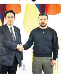
ஜப்பான் பிரதமர் ஷிபோ கிஷிபா (இடது) உக்கரை தலைநகர் கீவ் சென்றுள்ளார்.

ரஷ்யாவிற்கு எதிரான போரில் உக்கரனுக்கு ஆதரவளிக்கும் வகையில், ஜப்பான் பிரதமர் ஷிபோ கிஷிபா திடீர் பயணமாக உக்கரை தலைநகர் கீவ் சென்றுள்ளார்.