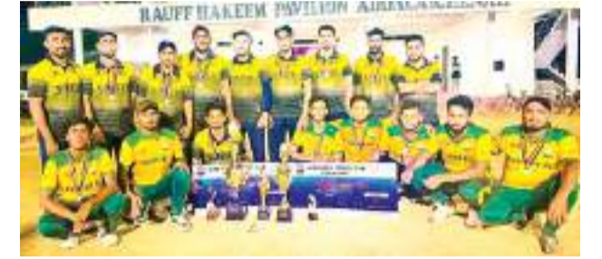
ஒலவில் கிழக்கு தினகரன் நிரூபர்

அட்டாளைச்சேனை கப்பர் சொனிக் விளையாட்டுக் கழகத்தின் ஏற்பாட்டில் நடைபெற்ற மின்னொளி கிரிக்கெட் சுற்றுப் போட்டியில் அட்டாளைச்சேனை சோபர் விளையாட்டுக் கழகம் சம்பியன் கிண்ணத்தை வென்றது. அட்டாளைச்சேனை பொது விளையாட்டு மைதானத்தில் கடந்த திங்கட்கிழமை (20) இரவு நடைபெற்ற இறுதிப் போட்டியில் அட்டாளைச்சேனை எவர் டொப் விளையாட்டுக் கழகத்தை 04 ஓட்டங்களால் வெற்றி பெற்றமை குறிப்பிடத்தக்கது. இறுதிப் போட்டியில் முதலில் துடுப்பெடுத்தாடிய சோபர் அணியினர் 5 ஓவர் நிறைவில் 4 விக்கெட் இழப்புக்கு 39 ஓட்டங்களைப் பெற்றனர். எவர் டொப் அணியினர் 2 விக்கெட்டினை இழந்து 35 ஓட்டங்களை மாத்திரம் பெற்று தோல்வியை தழுவியது.