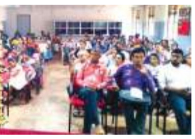
(திறப்பண தினகரன் நிருபர்)