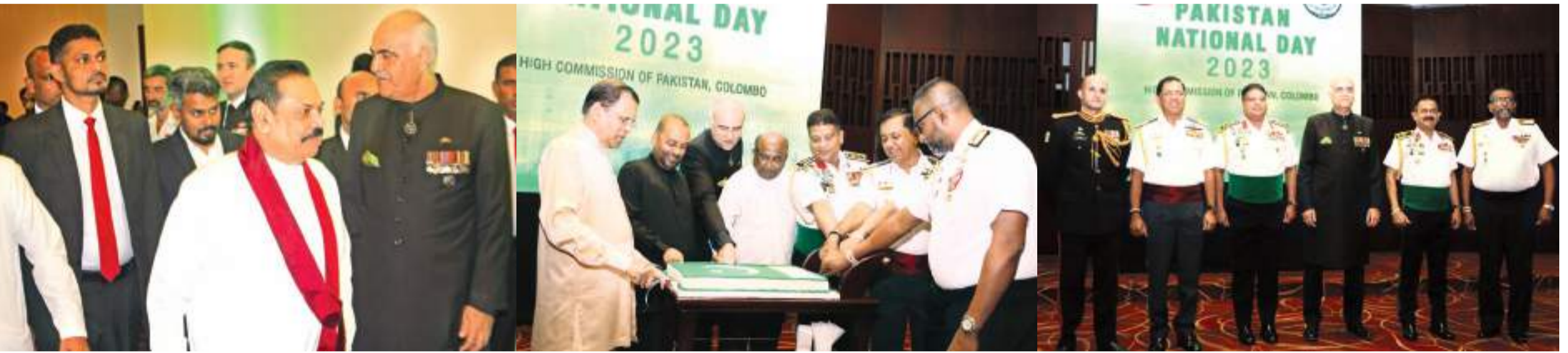
(தெரிவினை கல்லை விடிந்த நிரம்பு)

பாகிஸ்தான் தேசிய தின நிகழ்வுகள் (22) கொழும்பில் இடம்பெற்றது. விவசாய அமைச்சர் மஹிந்த