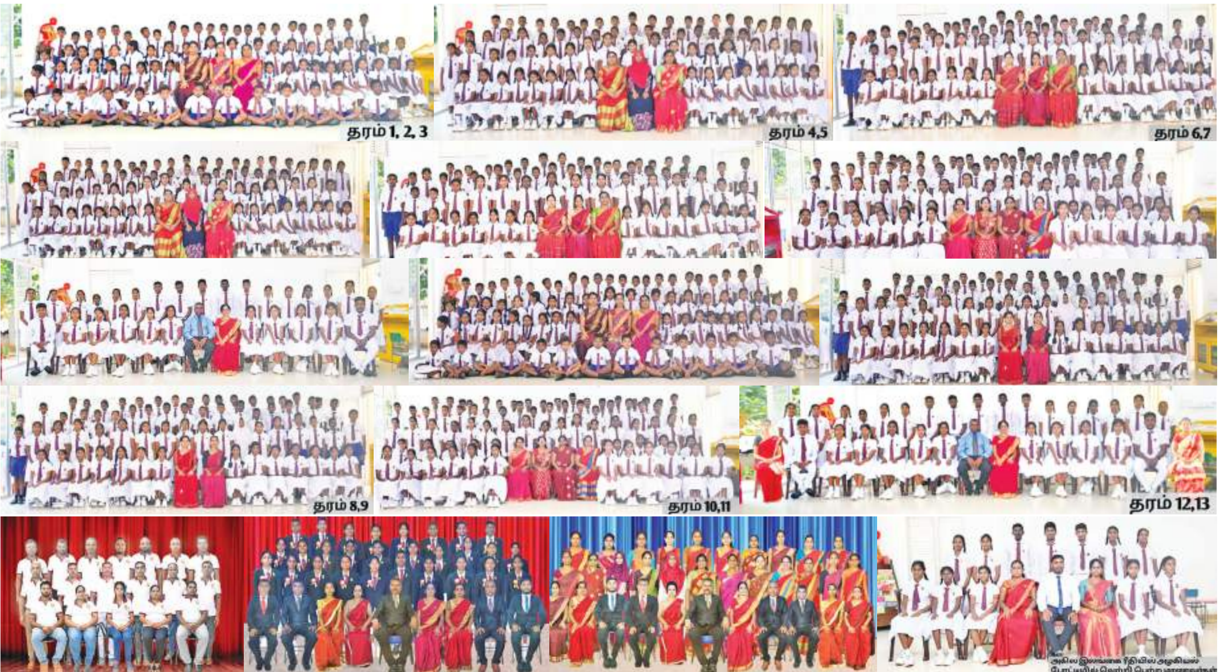
அகில இலங்கை ரீதியில் அருகிலும் போட்டியில் வெற்றி பெற்ற மாணவர்கள்