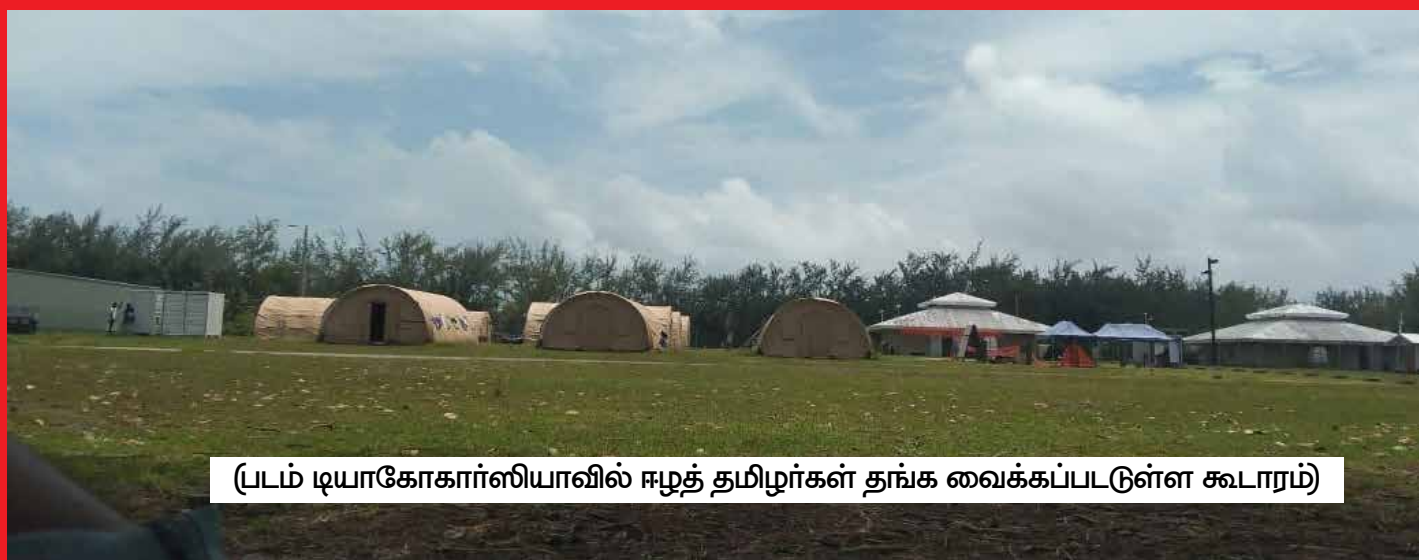
(படம் டியாகோகாரர்ஸியாவில் ஈழத் தமிழர்கள் தங்க வைக்கப்பட்டுள்ள கூடாரம்)