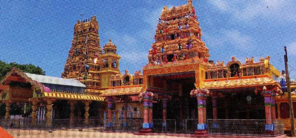
மேலே: திருமலர் கோயிலில் சிவ சுவாமி