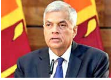
இதே வேளை இலங்கையின் பொருளாதாரம் கட்டியெழுப்பப்படும் வரை நாடாளுமன்றத்தை

அரசாங்கத்தை மாற்றுவதற்காக எவரும் முயற்சித்தால், அதற்கு இடமளிக்கப்படாது என்று ஜனாதிபதி ரணில் விக்கிரமசிங்க தெரிவித்துள்ளார். இராணுவத்தை பயன்படுத்தி அல்லது அவசரகால சட்டத்தை நடைமுறைப்படுத்தியாவது அதற்கு இடம் தரப்படமாட்டாது என்று அவர் குறிப்பிட்டுள்ளார். நாடாளுமன்றில் நேற்று புதன்கிழமை உரையாற்றியபோது ரணில் விக்கிரமசிங்க இந்த கருத்துக்களை வெளியிட்டார்.