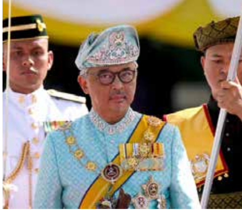
கட்சிகளும் ஒத்துழைக்க வேண்டும் என அவர் வலியுறுத்தி உள்ளார்.

முதற்கூட்டமாக ஐக்கிய (ஒற்றுமை UNITY GOVERNMENT) அரசாங்கம் அமைக்கலாம் என்ற யோசனையை முன்வைத்துள்ளார் மாமன்னர். கூட்டணிகளுக்கு அப்பாற்பட்டு இந்த ஏற்பாட்டுக்கு அரசியல் கட்சித் தலைவர்களும்