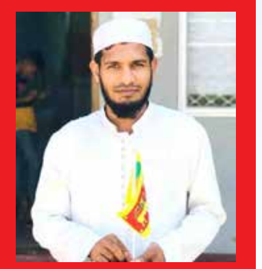
பி.ஆர். ரீசா சிறப்புக் கற்கை (அரபு மொழி)

நீங்கள் ஒவ்வொருவரும் ஆக்கத்திறன் கொண்டவர்களே. எளிமையில் மட்டுமல்ல சிக்கலானவற்றிலும் வல்லமை காட்டும் தொழில் நுட்பத் திறன் கொண்ட சாதனைகளை உருவாக்கவும் உங்கள் ஆக்கத் திறனே அவசியமானவை. நீங்கள் ஒவ்வொருவரும் தத்தமது ஆக்கத் திறனை வெவ்வேறு துறைகளில் புதுப்புது உற்பத்திகளாக வெளிக்கொண்டு வாருங்கள். உங்கள் உற்பத்திகளால் அதிகார வர்க்கத்தினரால் உற்பத்தி செய்யப்படும் ஏழ்மை சமூகத்தை நிச்சயம் காப்பாற்றி அடிமைக்கு விடுதலை அளிக்க முடியும். நீங்களருமாக இருந்தாலும் தொழில் நுட்பத் திறன் படைத்த சாதனைகளைக் கொண்டு தொழிற்சாலைகளை நிறுவி போதிலும் உலக ஆளும் வர்க்கத்தினர் போலல்லாமல் எல்லோருக்கும் சிக்கலாகத் தெரிகின்ற விடயங்களில் மாத்திரம் தொழில் நுட்பத் திறனைப் பயன்படுத்தி அதிலும் வல்லமை காட்டுவதுடன் அதிகமான மனித ஆக்கத்திறன்களுக்கு வாய்ப்பளிக்கும் படயான களம் அமைத்து அடிமைச் சமூகத்தினரிடமிருந்து அத்துமீறு பறித்தெடுக்கப்படும் வளச் சுரண்டல்களுக்கு முற்றுப்புள்ளி வைப்புகள். ஆக்கத்திறனே அற்புதமான அடிப்படையான ஆரோக்கியமான திறன் என்பதையும் எளிமையானதிலும், சிக்கலானதிலும் வல்லமை காட்டி இது ஒன்றே அவசியமானதும் போதுமானதெனவும் புரிந்து கொண்டு இலக்குகளுக்கு அப்பாலும் முன்னோக்கி நகருங்கள்.