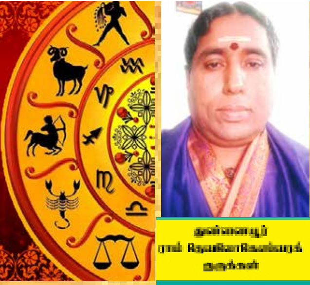
சுன்னம்மையுப் பரம் ரெய்யாசெனெகெண்டவயக் குருக்கள்

மேஷம் சற்று மத்திமமான பலன் தரும் வாரமாகும். எடுக்கின்ற முயற்சிகளில் பொறுமை நிதானம் தேவை. தொழில்சார்ந்த வேலைப்பளு அதிகமாக இருக்கும். கொடுக்கல் வரங்க்களில் இழுபறி நிலை காணப்படும். பணவரவு சற்று அதிகமாக இருக்கும். தேவையற்ற விடயங்களில் கவனம் செலுத்த வேண்டாம். பெண்களுக்கு சஞ்சல நிலை. மாணவர்களுக்கு கவனம் தேவை. அனுகூலமான நாள் - திங்கள், அனுகூலமான திகதி - 27