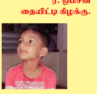
ர. ஓயிசன் தையிட்டி கிழக்கு.