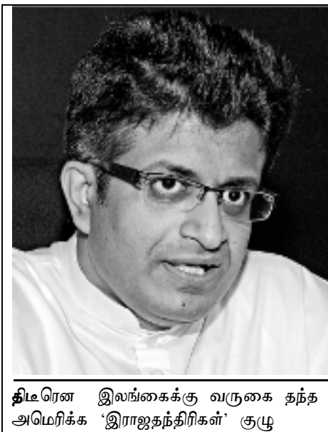
திடீரென இலங்கைக்கு வருகை தந்த அமெரிக்க 'இராஜதந்திரிகள்' குழு