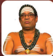
அருட்குருநாதர். ஒளியகம் ந. ஒளியரசு ஓயா