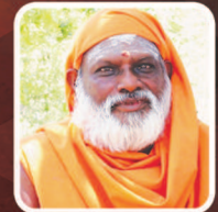
தென்கயிலை ஆதீன குருமுதல்வர்