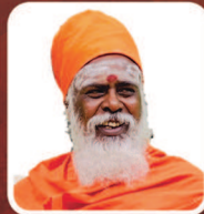
நல்லை ஆதீன குருமுதல்வர்