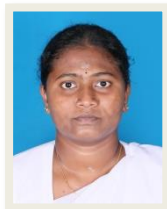
ஆக்கம் : ஜெ.லனுஜா கணிதம் தமிழ்மொழி மூலம்

பசந் தழைகள் பெருக்கெடுக்கும் கனிய வள மரங்களையும் இயற்கை அழகு கொஞ்சம் வயல்களையும் கொண்டமைந்த இலங்கையின் வடபால் அமைந்துள்ள யாழ்ப்பாணம் எனும் நகர மண்டலத்தில் கோப்பாய் எனும் திருவூரில் அமைந்த வண்ணம் பல லட்ச முத்து சிற்பிகளான மாணவ ஆசிரியர்களின் கனவு இலட்சியங்களை தூண்டா மணி விளக்கு பிரகாசமாய் ஒளிர்ச் செய்யும் சிந்தனை சொல் செயல் எனும் மகுடவாசகத்தை தன்னகத்தே கொண்டு மிளிர்கின்ற எம் கல்லூரித் தாயே எம் கல்லூரித் தாயே கிராமம் விட்டு கிராமம் மாவட்டம் விட்டு மாவட்டம் என பல இலட்ச மாணவ மணிகளை தன் கருவறையுயில் சுமந்த வண்ணம் தன் பிள்ளைகள் பாரினில் சிறந்து விளங்கிட கண்ணோட்டமாய் அமைந்துள்ள எம் தாயே பற்பல துறைகளை தன்னகத்தே கொண்டமைந்து சீருடனே பணியாற்றி கட்டுக்கோப்பான தலமையுடன் கூடிய நிர்வாகத்தை மிடுக்குடனே கொண்டமைந்து தன்னிகரில்லா பணியை ஆற்றிவருகிறாள் எம் தாய் நூற்றாண்டு கடந்தாலும் மங்காத் துணிவுடனே ஆண்டாண்டு காலம் பல குடும்பங்களின் விடிவெள்ளியாய் அமைய என்றென்றும் துணையாய் அமைவாள் எம் தாய்