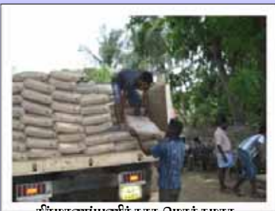
நிர்மாணப்பணிக்காக மொத்தமாக தருவிக்கப்பட்ட சீமெந்து பொதிகள் இறக்கப்படும் காட்சி

இத்திட்டத்தின் கீழ் யாழ்ப்பாண மாவட்டத்துக்கு 11,256 வீடுகள் ஒதுக்கப்பட்டுள்ளது. ஆனால் யாழ் கண்டி வீதிப் போக்குவரத்து தடை காரணமாக, மாவட்டத்துக்கு செல்லும் சகல பாவனை மூலப் பொருட்களும் கடல்மார்க்கமாக கப்பல்கள் மூலமே கொண்டு செல்ல வேண்டியேற்பட்டது. அரசாங்கக் கப்பல்களில் உணவுப் பொருட்களுக்கே முன்னுரிமையளிக்கப்பட்டதால் கட்டிடப் பொருட்களான சீமெந்து, இரும்புக் கம்பி, கூரை ஓடுகள் என்பனவற்றை யாழ்ப்பாண மாவட்டத்துக்குக் கொண்டு செல்வதில் பாரிய சவாலை எதிர் நோக்க வேண்டியிருந்தது. அத்துடன் போக்குவரத்துச் செலவும் அதிகரித்துள்ளது.