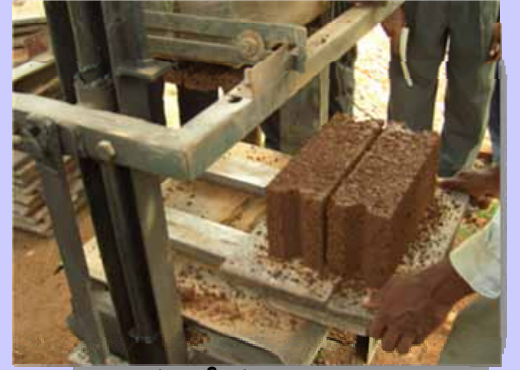
கல் அரியும் நடைமுறை

மற்றும் அத்திவாரத்திற்குப் பயன்படுத்தும் கருங்கற்களுக்கு சிறந்த மாற்றீட்டுக் கட்டுமாணப் பொருளாக கிறவல் கல் அடையாளம் காணப்பட்டுள்ளது.