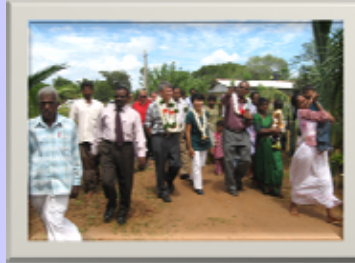
உலக வங்கியின் வதிவிடப் பிரதிநிதி, முகாமைத்துவப் பணிப்பாளர் வவுனியா களப்பிரதேசத்தை

பின்னர் கிராம மக்கள், பயனாளிகள், அரச பணியாளர்களுடனான கலந்துரையாடலிலும் பங்குபற்றினார்.