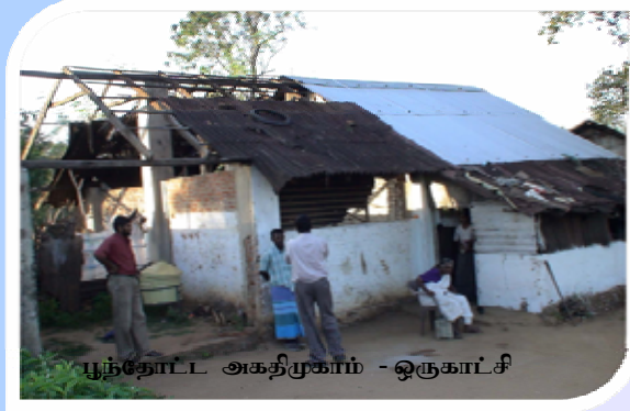
பூந்தோட்ட அகதிமுகாம் - ஒருகாட்சி

கடந்த கால இன முரண்பாடுகள் காரணமாக, குறிப்பாக 1979,1980,1983 ஆண்டுகளில் நடைபெற்ற கலவரங்கள் காரணமாக, மலையக தோட்டங்களில் பணியாற்றிய பெருந்தொகையான குடும்பங்கள், தமது வாழ்விடங்களிலிருந்து நாட்டின் பல பகுதிகளுக்கு இடம் பெயர்ந்தனர். இவர்களில் கணிசமானவர்கள், வடக்கு மாகாணத்தின் வவுனியா, முல்லைத்தீவு, கிளிநொச்சி, மன்னார் மாவட்டங்களில் அரசு காணிகளில் குடியேறியிருந்தனர். அக்காலப்பகுதியில் இக் குடும்பங்களில் பெரும்பாலோருக்கு இலங்கைப் பிரஜாஉரிமையில்லாத காரணத்தால் அவர்கள் அத்துமீறி சுவீகரித்திருந்த அரசு காணிகளுக்கான உரிமையை பெறமுடியாதவர்களாக இருந்தனர்.