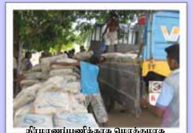
நிர்மாணப்பணிக்காக மொத்தமாக தருவிக்கப்பட்ட சீமெந்து பொதிகள் இறக்கப்படும் காட்சி

இத்திட்டத்தின் கீழ் யாழ்ப்பாண மாவட்டத்துக்கு 11,256 வீடுகள் ஒதுக்கப்பட்டுள்ளது. ஆனால் யாழ் கண்டி வீதிப் போக்குவரத்து தடை காரணமாக, மாவட்டத்துக்கு செல்லும் சகல பாவனை மூலப் பொருட்களும் கடல்மார்க்கமாக கப்பல்கள் மூலமே கொண்டு செல்ல வேண்டியேற்பட்டது. அரசாங்கக் கப்பல்களில் உணவுப் பொருட்களுக்கே முன்னுரிமையளிக்கப்பட்டதால் கட்டிடப் பொருட்களான சீமெந்து, இரும்புக் கம்பி, கூரை ஓடுகள் என்பனவற்றை யாழ்ப்பாண மாவட்டத்துக்குக் கொண்டு செல்வதில் பாரிய சவாலை எதிர் நோக்க வேண்டியிருந்தது. அத்துடன் போக்குவரத்துச் செலவும் அதிகரித்துள்ளது.