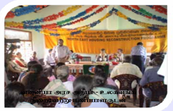
வவுனியா அரசு அதிபர் - உலகவங்கி குழுவோடு பணியாளருடன்

இவ்வாறு குடியமர்த்தப்படும் குடும்பங்களில் 5,000 குடும்பங்களுக்கு நிரந்தர வீட்டு வசதி வழங்குவதற்கான நிதி நன்கொடையை வழங்கும்படி அவர் அண்மையில் மாவட்டத்துக்கு களப் பரசோதனைக்கு சென்ற உலக வங்கியின் பிரதிநிதிகளிடம் கேட்டுக்கொண்டார். இவ்விடயத்தை கவனத்தில் எடுத்த உலக வங்கிக் குழு வடக்கு கிழக்கு வீடமைப்பு மீள்நிர்மாணத் திட்டத்தின் உத்தேச இரண்டாம் கட்டத்தின் பொழுது இவ்விடயத்தைக் கவனத்தில் கொள்வதாகத் தெரிவித்துள்ளது.