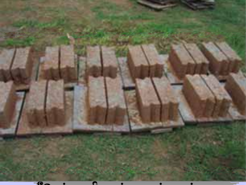
சீமெந்து ,கிறவல்,மணல் கலந்த கட்டிட அரிவு கல்

கடந்த முன்று வருடங்களில் வடக்கு கிழக்கு வீடமைப்பு மீள்நிர்மாணத்திட்டமானது ஏறக்குறைய 40 ஆயிரம் வீடுகளை கட்டிமுடித்துள்ளது. குறுகிய காலத்தில் குறிப்பிட்ட பிரதேசத்தில் இப்பாரிய கட்டுமாணப்பணியைச் செய்வதற்கு இப் பிரதேசத்தில் கட்டுமாண மூலவளங்கள் போதிய அளவு இல்லை. மேலும் மட்டுப்படுத்தப்பட்ட அளவிலேயே கட்டுமாணப்பொருட்கள் கிடைப்பதால் இந்த கட்டுமாணப் பொருட்களுக்கு அதிக கிராக்கியையும் அதிக விலை உயர்வையும் ஏற்படுத்தும் என்று திட்டத்தின் முன்னோடி வீடமைப்புத் திட்டத்தை நடைமுறைப்படுத்தும் போது உணரப்பட்டது.