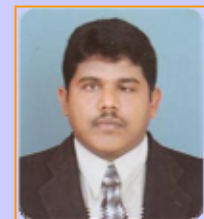
Eng.தெ.தவராசா மாவட்டப் பொறியியலாளர்