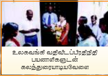
உலகவங்கி வதிவிடப்பிரதிநிதி பயனாளிகளுடன் கலந்துரையாடியவேளை