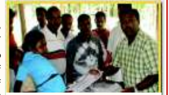
பயனாளியொருவருக்கு வீட்டுத்திட்ட இலச்சினை வழங்கிவைத்த போது

பிரதேச செயலாளர் பிரிவு ரீதியாக அபிவிருத்தி திட்டங்களை மேற்பார்வை செய்யும் நடவடிக்கைகளின் ஒரு கட்டமாக தேச நிர்மாண அமைச்சர் கௌரவ சசந்த புஞ்சி நிலமே அவர்கள், அம்பாறை மாவட்டத்தின் சகல பிரதேச செயலர் பிரிவுகளுக்கும் விஜயம் செய்து பிரதேச அபிவிருத்தி நடவடிக்கைகளை மீளாய்வு செய்தார். அதன் அடிப்படையில் வடக்கு கிழக்கு வீடமைப்பு மீள் நிர்மாணத் திட்டத்தின் பயனாளிகளோடும், கிராமிய மக்களோடும், திட்ட பிரதிப்பணிப்பாளரோடும் திட்டத்தை சிறந்த முறையில் முன்னெடுத்துச் செல்வதற்கான ஆலோசனைகளையும், பணிப்புரைகளையும் வழங்கினார்.