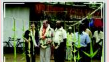
வதிவிடப் பிரதிநிதியும் ஆய்வுக் குழுவினரும் திட்ட முன்னேற்றத்தை பார்வையிடல்

இத் திட்ட செயற்பாட்டின், செயல்திறமை, தொடர்புடமை, செயல்பாட்டுத் தன்மை, பயனாளிகளது பங்குபற்றல், திட்ட பயன்கள் நிலைத்து நிற்கும் தன்மை என்பனவற்றை ஆய்வு செய்வதற்காக இடைக்கால மீளாய்வுக் குழுவொன்று ஏப்ரல் மாதத்தில் அம்பாறை மாவட்டத்திற்கு விஜயம் செய்து வளாத்துப்பிட்டி என்ற கிராமத்தை ஆய்வு செய்தது. இக் கிராமத்தில் மூலின மக்களும் வாழ்வதோடு கடந்த கால யுத்தத்தால் பூரணமாகப் பாதிக்கப்பட்டு மீள்குடியேற்றப்பட்ட கிராமமான இங்கு இந் நிதியிலிருந்து 87 வீடுகள் மீள்நிர்மாணம் செய்யப்படுகின்றன.