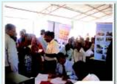
பொதுமக்களுக்கு திட்டம் தொடர்பாக விளக்கமளிக்கப்படுகின்றது

இரண்டாம் நாள் நிகழ்வில் அனர்த்த நிவாரண அமைச்சர் கௌரவ அமீர் அலி அவர்கள் எமது காட்சிக் கூடத்திற்கு சமூகம் கொடுத்து, சமூக மளித்த மக்களையும் எமது திட்ட பணியாளர்களையும் சந்தித்து ஊக்கப்படுத்தினார். 3,341 மக்கள் இக் கூடத்தை தரிசித்ததோடு 2,014 பயனாளிகள் தமக்கான கொடுப்பனவுகளையும் பெற்றுக் கொண்டனர்.