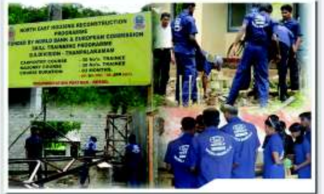
களப் பயிற்சியில் ஈடுபடும் இளைஞர்கள்

திட்ட முன்மொழிவின்படி 1,200 இளைஞர்களுக்கு திட்ட காலத்தில் 800 பேருக்கு மேசன் பயிற்சியும் 400 பேருக்கு தச்சத் தொழில் பயிற்சியும் வழங்குவதற்கு திட்டமிடப்பட்டிருந்தது. ஆரம்பத்தில் இதனை செயற்படுத்துவதற்கு முன்னோடியாக பல ஆலோசகர்கள் நியமிக்கப்பட்டு, UNDP உதவியுடன் கட்டிட ஒப்பந்தக்காரர் மூலம் முதலாவது பயிற்சி நடாத்தப்பட்டு பயிற்சி பெற்றவர்களுக்கு அத்தாட்சிப் பத்திரமும் வழங்கப்பட்டது. ஆனால் பயிற்சி பெற்றவர்கள் எவரும் இத் திட்டத்திற்காக எவ்விதப் பங்களிப்பும் செய்யவில்லை. பலர் வெளிநாட்டு வேலை வாய்ப்புக்களைப் பெற்று சென்று விட்டனர்.