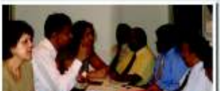
உலகவங்கி பிரதிநிதிகளுக்கும் திட்ட உத்தியோகத்தர்களுக்கும் இடையான

அரசாங்கத்தின் கோரிக்கைக்கு இணங்க உலக வங்கி, திட்ட உதவியாக மேலதிகமாக 43 மில்லியன் அமெரிக்க டொலர்களை வழங்க முன் வந்துள்ளது. இது தொடர்பாக திட்ட உத்தியோகத்தர் களுக்கிடையிலான கலந்துரையாடல் மார்ச் மாதம் 26ம் திகதிக்கும் ஏப்ரல் 02ம் திகதிக்குமிடையில் கொழும்பில் நடைபெற்றது.