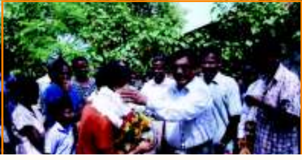
உலகவங்கி வதிவிடப்பிரதிநிதி மலர்மாலை அணிவித்து வரவேற்கப்பட்டபோது

உலக வங்கியின் நிதி உதவியுடன் யாழ்ப்பாண மாவட்டத்தில் நீதி நிர்வாக மறுசீரமைப்பு திட்டம், சுனாமி வீடமைப்பு திட்டம், மீளெழுச்சித் திட்டம் மற்றும் வடக்கு கிழக்கு வீடமைப்பு மீள் நிர்மாணத் திட்டம் என்பன நடைமுறைப்படுத்தப்பட்டு வருகின்றன.