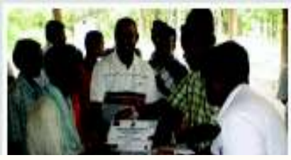
பயனாளியொருவருக்கு வீட்டுத்திட்ட இலச்சினை வழங்கியபோது

வடக்கு கிழக்கு வீடமைப்பு மீள் நிர்மாணத் திட்டம், தேச நிர்மாண அமைச்சின் கீழ் செயற்படுத்தப்படும் திட்டமாகும்.