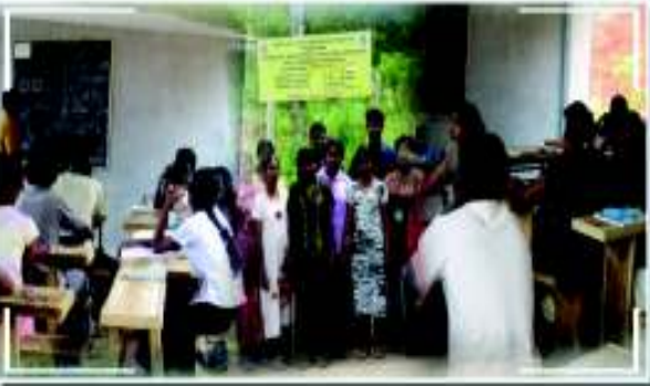
பயிற்சி வகுப்பில் இளைஞர்கள்

அத்துடன் எமது திட்டத்தில் தொழிற்பயிற்சி பெற்ற பலர் இப்பொழுது தாமாகவே கட்டிடத் தொழிலை செய்வதுடன் நாளொன்றுக்கு ரூபா 800.00 - 1,200 வரையிலான வருமானத்தைப் பெறுவதையும் காணலாம்.