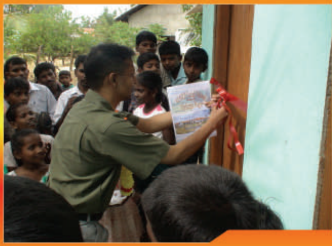
திருகோணமலை, பத்தினிபுரம் கிராமத்தில் சம்பிரதாய நூர்வமாக வீடு திறந்துவைக்கப்படுகின்றது