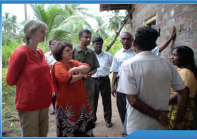
திருகோணமலை, கோமரங்கடவெலவில் பயனாளிகள் குடும்பத்துடன் கலந்துரையாடல்.