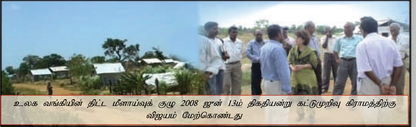
உலக வங்கியின் திட்ட மீளாய்வுக் குழு 2008 ஜூன் 13ம் திகதியன்று கட்டுமுறிவு கிராமத்திற்கு விஜயம் மேற்கொண்டது

பொதுப் போக்குவரத்து வசதிகள் இல்லாமையால் மக்கள் கால்நடையாகவோ அல்லது துவிச்சக்கர வண்டி மூலமாகவோ தான் பயணிக்கின்றனர். நோயாளர்களை தொலைதூரத்திலுள்ள வைத்தியசாலைகளுக்கு கொண்டு செல்வதில் இக் கிராம மக்கள் பெரும் இன்னல்களை அனுபவிக்கின்றனர். இரவு நேரங்களில் பாம்பு தீண்டிய பலர் வைத்தியசாலைக்குக் கொண்டுசென்று சேர்ப்பதன் முன்னதாகவே உயிரிழந்த சம்பவங்கள் பல உண்டு.