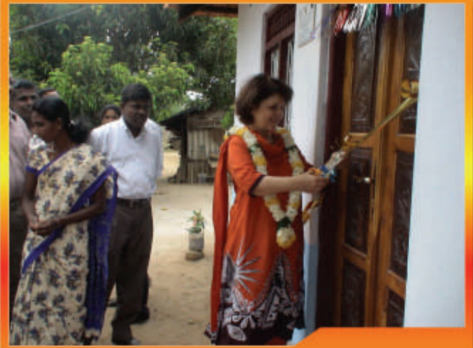
திருகோணமலை, தெலுங்கு நகரில் சம்பிரதாய நூர்வமாக வீடு திறந்துவைக்கப்படுகின்றது