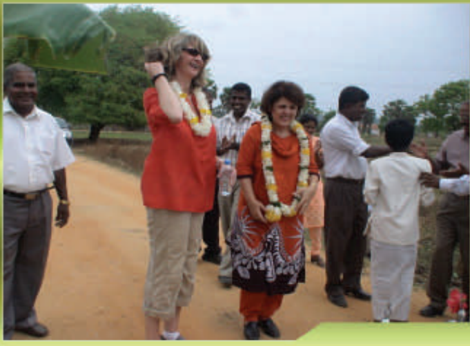
திருகோணமலை மாவட்டத்துக்கான விஜயத்தின் போது பயனாளிகள், கண்காணிப்புக் குழுவினருக்கு அமோக வரவேற்பளித்தனர்