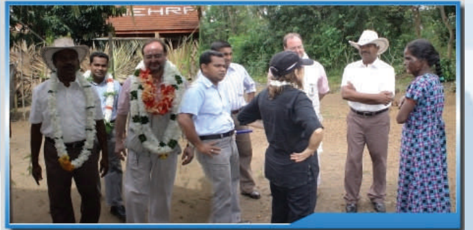
அம்பாறை மாவட்டத்தின் திட்டப் பயனாளிகளினால் ஐரோப்பிய ஒன்றியப் பிரதிநிதிகள் வரவேற்கப்பட்டனர்.

மீளக் குடியமர்ந்த அனைத்துக் குடும்பங்களினதும் சிறார்கள் பாடசாலைக்குக் கிரமமாக சென்றுவருகின்றார்கள் என்பது அச்சமூகத்தினராலேயே எதிர்பார்க்கப்படாத ஒரு முன்னேற்றகரமான தாக்கம் என அவ்வறிக்கையில் மேலும் சுட்டிக்காட்டப்பட்டுள்ளது. கணவன் மனைவி இணைந்த வங்கிக் கணக்கு நடைமுறை அறிமுகப்படுத்தப்பட்டதன் காரணமாக பால் சமத்துவம் பேணப்பட்டுள்ளது. பெண் தலைமைத்துவக் குடும்பங்கள் திருப்திகரமான வகையிலே வழிநடாத்தப்பட்டுள்ளன எனவும் அவ்வறிக்கையில் சுட்டிக்காட்டப்பட்டுள்ளது.