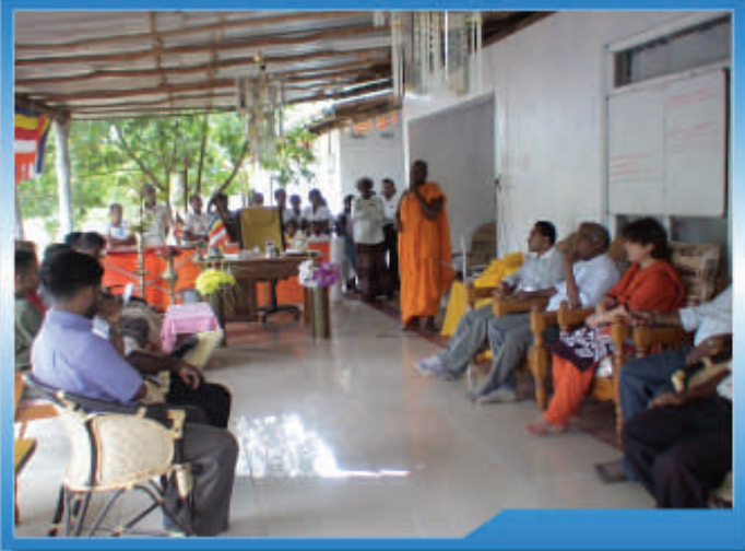
திருகோணமலை, மொறவெவவில் பயனாளிகளுடனான சந்திப்பு