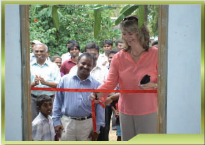
மட்டக்களப்பு, வாகரையில் சம்பிரதாய நூர்வமாக வீடு திறந்துவைக்கப்படுகின்றது