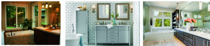
Real Estate page compiled by Charles Devasagayam