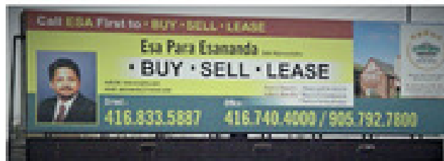
Esa on Billboard at Major Intersections in Toronto and Greater Toronto Area