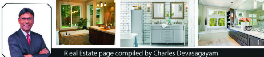
Real Estate page compiled by Charles Devasagayam

Even with proactive maintenance, sometimes you just can't prevent the unexpected — but you can prepare for it. Protect your home and what's in it with a solid home insurance policy. Get a quote at onlia.ca .