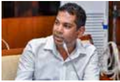
அடிப்படையில் விநியோகத்திற்கான அமைச்சர் கஞ்சன விஜயசேகர தெரிவித்துள்ளார்.

விலை குறைப்பு தீர்மானம் என்று எரிபொருளை கொள்வனவு செய்வதற்கான விநியோகத்திற்கு இழப்பீட்டில் பங்கு வழங்குவதற்கு நடவடிக்கை எடுக்கப்பட்டுள்ளதாக மின்சக்தி மற்றும் எரிசக்தி அமைச்சர் கஞ்சன விஜயசேகர தெரிவித்துள்ளார்.