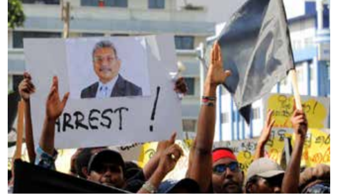
கோட்டாபய ராஜபக்ஷ தப்பிச் செல்லும்படி செய்தனர். போராட்டக்காரர்களின் இன்றைய நிலையாடு என்ன?

இலங்கையில் ஜனாதிபதி ஒருவரை விரட்டியடிக்கும் அளவுக்கு நடைபெற்ற ஆர்ப்பாட்டத்தில் ஆரம்ப நாளாக 2022ம் ஆண்டு மார்ச் மாதம் 31ம் திகதி அமைந்திருந்தது.