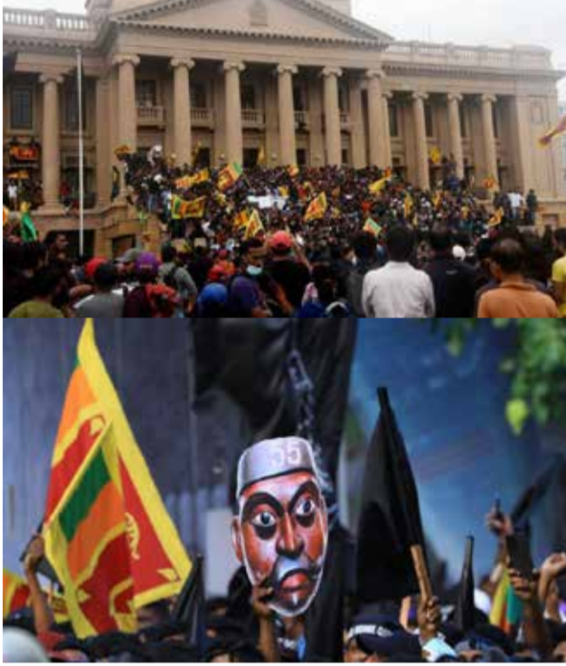
மீது, பாதுகாப்பு பிரிவினர் தடியடி பிரயோகம் நடத்த ஆரம்பித்தனர்.

கண்ணீர் புகை பிரயோகம் மற்றும் நீர்தாரை பிரயோகம் ஆகியவற்றுக்கும் கட்டுப்பாடாத ஆர்ப்பாட்டக்காரர்கள்