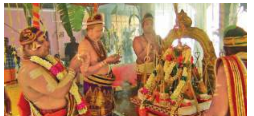
டெவோன் நீர்மீச்சியின் தொடக்கத்தில் எழில் கொஞ்சும் மலைப்பகுதியில் எழுந்தருளியுள்ள பத்தனை மாநகர் அருள்மிகு ஸ்ரீ சிவசுப்பிரமணிய சுவாமி திருக்கோயில் கும்பாபிஷேக பெருவிழை நேற்று (05) மிகச் சிறப்பாக நடைபெற்றது.