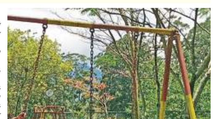
ஏற்படுத்தும். ஆகையால் சம்பந்தப்பட்ட பிரதேச சபை உடன் கவனம் செலுத்தி அவற்றை அகற்ற நடவடிக்கை எடுக்க வேண்டும் என கோரிக்கை விடுகின்றனர்.

மல்கெலியா பிரதேசசபைக்கு சொந்தமான சிறுவர் பூங்காவிலுள்ள மூன்று மரங்களில் குளவிக்கூடுகள் உள்ளன. இத்தகான சிறுவர்கள் அப்பகுதிக்கு வருவதில் அச்சம் தெரிவிக்கின்றனர். குளவியினால் அங்கு விளையாடும் சிறார்கள்க்கு ஆபத்து ஏற்படும் வாய்ப்பு உள்ளது. இதுகுறித்து சம்பந்தப்பட்ட மல்கெலியா பிரதேசசபை முன்வந்து குளவிக்கூடுகளை அகற்ற நடவடிக்கை எடுக்க வேண்டுமென கோரிக்கை விடுகின்றனர். மூன்று மரங்களிலுள்ள குளவிக்கூடுகள் மிகவும் விஷத்தன்மை வாய்ந்ததாகவிருப்பதாக மக்கள் தெரிவிக்கின்றனர். மூன்று குளவிக்கூடுகள் உள்ளன. இதில் வாழும் குளவிக்கூடுகளை முறித்து விடும் பட்சத்தில் அங்குள்ள சிறார்களுக்கு ஆபத்தை