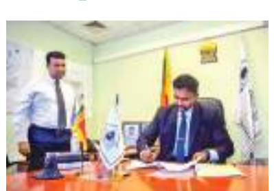
கொண்டார். இதுதொடர்பில் அவர் கருத்து தெரிவிக்கையில், தற்போதைய பொருளாதார நெருக்கடி சூழ்நிலையிலிருந்து மீண்டெழ வேண்டும். பெருந்தோட்ட தொழிலாளர்களின் வளர்ச்சிக்கும் மலையக மக்களின் எழுச்சிக்கும் அமைச்சர் ஜீவன் தொண்டமானால் வழிகாட்டலுக்கமைவாக பல திட்டங்களை முன்னெடுக்கவுள்ளேன். பெருந்தோட்ட தொழிலாளர்களை அபிவிருத்தி செய்யவும் பெருந்தோட்ட தொழிலாளர்களின் வாழ்வாதாரத்தை உயர்த்துவதற்கும் அவர்களின் நலன் சார்ந்த புதிய வேலைத்திட்டங்களை செயற்படுத்தவும் திட்டமிட்டுள்ளேன். இந்த வேலைத்திட்டங்களை வெற்றிகரமாக செயற்படுத்த அனைத்து தரப்பினரும் ஒத்துழைப்பு வழங்க வேண்டும் என கூறினார்.