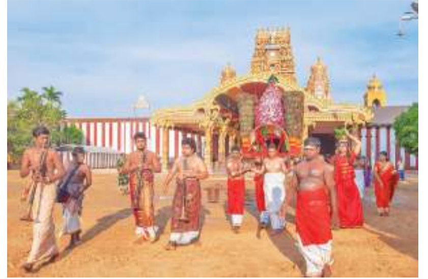
வரலாற்றுச் சிறப்புமிக்க நல்லூர் சுந்தரவாமி கோயிலில் பங்குனி உத்தர பார் காவடி பவனி நேற்றைய தினம் புன்கிழமை மிகவும் பக்தி பூர்வமாக இடம்பெற்றது.