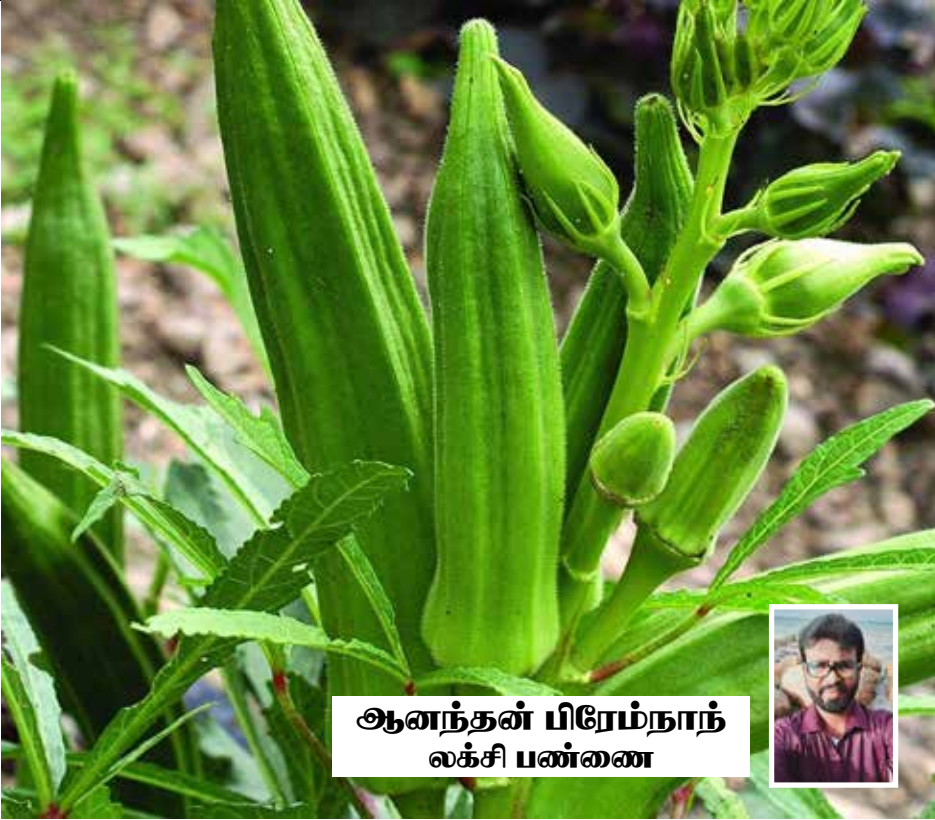
ஆனந்தன் பிரேம்நாந் லக்ஷி பண்ணை

“ பயிர் வகைகளில் வெண்டை இலகுவாகவும் சிரமம் இல்லாமலும் பயிர் செய்யலாம். நாங்கள் எதிர்பார்ப்பதை விட மிக விரைவில் அறுவடைக்கு தயாராகும். மழை காலங்கள் தவிர்ந்த ஏனைய அனைத்து மாதங்களிலும் தொடர்ச்சியாக நடுகை செய்யலாம். வெண்டைக்காயை பொறுத்தவரை பத்துக்கு மேற்பட்ட ரகங்கள் உள்ளன. ”