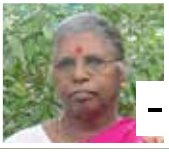
- தமிழ்க்கவி -