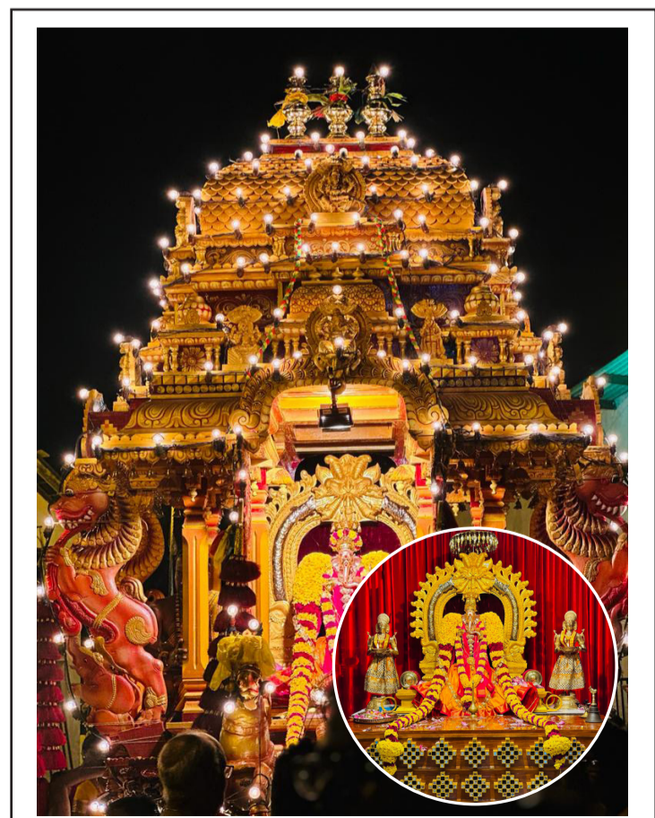
நல்லூர் வடக்கு சந்திரசேகர பிள்ளையார் ஆலயத்தின் மஞ்சத் திருவிழா நேற்றுமுன்தினம் இரவு நடைபெற்றபோது...!