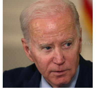
பி.சி. செய்தியாளருக்கு பைடன் இதனை தெரிவித்துள்ளார். (அ)

வெள்ளை மாளிகையின் உயிர்த்த ஞாயிறு சிறுவர் கொண்டாட்டத்துக்கு முன்னதாக என்.