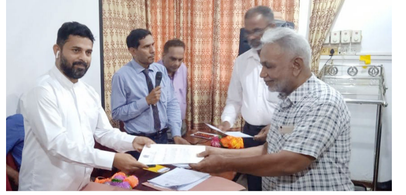
புயலை பூரணப்படுத்துமாறு கேட்டுக்கொண்டார்.

எதிர்வரும் சித்திரை புத்தாண்டுக்கு முன்னர் இந்த வீட்டுத் தொகுதி மக்களிடம் கையளிக்கப்படும். இதற்காக கல்முனை பிரதேச செயலாளர் உரிய நடவடிக்கைகளை எடுத்து உரிய பயனாளிகளை தெரிவு செய்யும் பட்