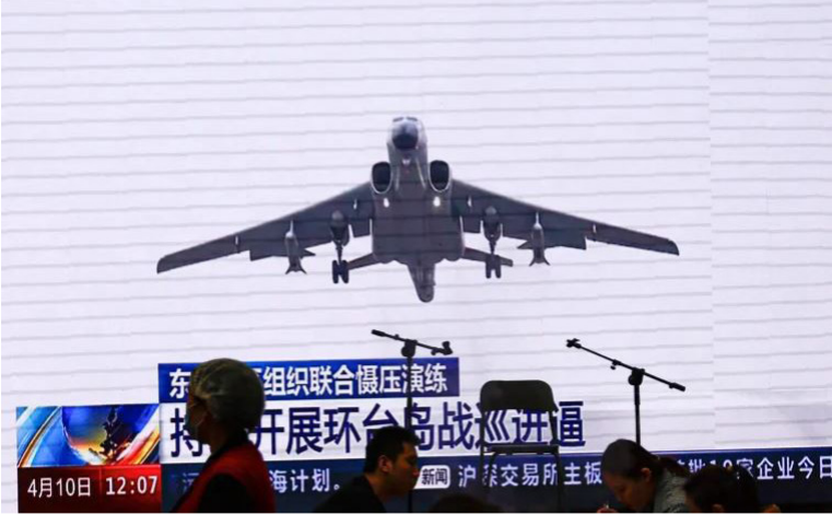
இவற்றில் 54 விமானங்கள் தாய்வாணின் தென்மேற்கு மற்றும் தென்கிழக்கு வான் பாது

நேற்று முன்தினம் திங்கட்கிழமை சீனாவின் 12 போர்க்கப்பல்கள், 91 விமானங்கள் தாய்வாளைச் சூழ்ந்த பகுதிகளில் காணப்பட்டதாகவும் அவ்வமைச்சு தெரிவித்துள்ளது.