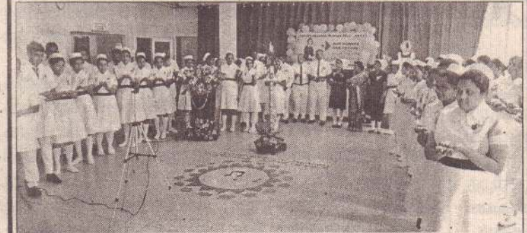
சர்வதேச தாதியர் தின நிகழ்வு நேற்று முற்பகல் கிளிநொச்சி மாவட்ட பொது வைத்தியசாலை மண்டபத்தில் இடம்பெற்றது. இதன் போது, தாதிய சேவையில் ஈடுபட்டு மறைந்த தாதியர்கள் நினைவு கூரப்பட்டமை குறிப்பிடத்தக்கது.

அதாவது கரைச்சி பிரதேச செயலாளர் பிரிவில் 765.28 கிலோமீற்றர் கிராமிய வீதிகளும் கண்டாவளை பிரதேச செயலாளர் பிரிவில் 301.91 கிலோமீற்றர் கிராமிய வீதிகளும் பூநகரி பிரதேச செயலர் பிரிவில் 428.79 கிலோ மீற்றர் கிராமிய வீதிகள் பச்சிலை பள்ளி பிரதேச செயலாளர் பிரிவில் 221.73 கிலோ மீற்றர் கிராமிய வீதிகளும் புனரமைக்க வேண்டியுள்ளது. (4-6-315)