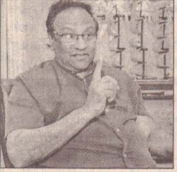
(கொழும்பு) பௌத்த மதத்தின் பெருமை

க்குரிய சியாம் நிகாயவின் 270 ஆவது வருட நிறைவு திருகோணமலை மாவட்டத்தில் நான்கு நாளைய நிகழ்ச்சியாக கொண்டாடப்பட்டுள்ளது. இதற்கு தமிழ்த் தேசியக் கூட்டமைப்பு உட்பட தமிழ் அரசியல்வாதிகள் எதிர்ப்பு தெரிவித்துள்ளதாக முன்னாள் பொதுமக்கள் பாதுகாப்பு அமைச்சரும் பொதுஜன பெரமுன பாராளுமன்ற உறுப்பினருமான ரியர் அட்மிரல் சரத்