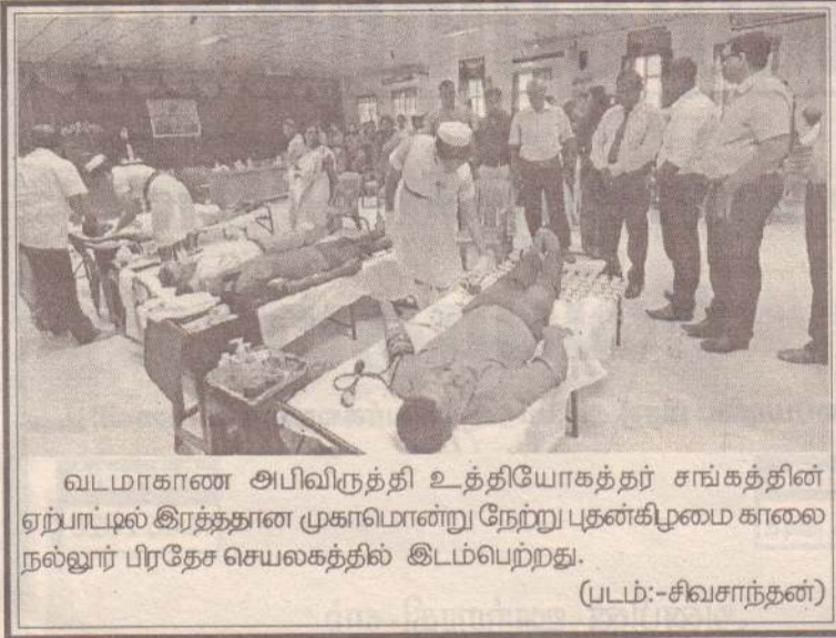
வடமாகாண அபிவிருத்தி உத்தியோகத்தர் சங்கத்தின் ஏற்பாட்டில் இரத்ததான முகாமொன்று நேற்று புதன்கிழமை காலை நல்லூர் பிரதேச செயலகத்தில் இடம்பெற்றது.