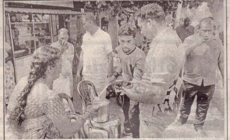
தென்மராட்சி-வரணி மத்திய கல்லூரி முன்பாக நேற்று புதன்கிழமை முள்ளிவாய்க்கால் நினைவுக்கஞ்சி வழங்கி அஞ்சலியும் செலுத்தப்பட்டது.

டைய பிள்ளைகளுக்கு கற்றுக் கொடுக்கும்படியாகவும் கேட்டு நிற்கின்றோம். இந்த முள்ளிவாய்க்கால் நிகழ்வுக்கு காரணமான அத்தனை பேரும் தண்டிக்கப்பட வேண்டும் என்கிற அந்த ஒரு மித்த குரலில் மக்களினுடைய எண்ணங்கள் அனைத்தும் நிறைவேறக் கூடிய மக்களுக்கான நிர்வாக அல்லது எந்த தாகத்தோடு நாங்கள் போராடினோமோ அந்த தாகங்கள் நிறைவேறும்படியாக நாங்கள் எம்மை அர்ப்பணிப்பதும் அவசியமாக இருக்கிறது. இன்றும் இடம் பெற்று வருகின்ற பல்வேறு வகையான இன அழிப்பு வாய்க்கால்கள், பௌத்த மயமாக்கல்கள், இவற்றுக்கு எதிராகவும் நாங்கள் தொடர்ந்து குரல் கொடுப்பது அவசியம் என்பதை இந்த வேளையிலே உணர்த்தி இதிலே அனைவரையும் பங்கெடுக்குமாறு அன்போடு கேட்டு நிற்கின்றோம் என தெரிவித்தார். (4-299)