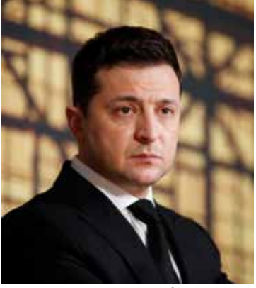
கீவ், ஏப். 13

உக்ரைனிய இராணுவ வீரர் ஒருவரின் தலை துண்டிக்கப்படும் வீடியோ சமூக ஊடகங்களில் பரவி வருகிறது. ரஷ்ய படையினரே தலையை துண்டித்த தரப்பினர் ஜனாதிபதி வொலோடிமிர் ஜெலன்ஸ்கி குற்றம்சுமத்தியுள்ளார்.