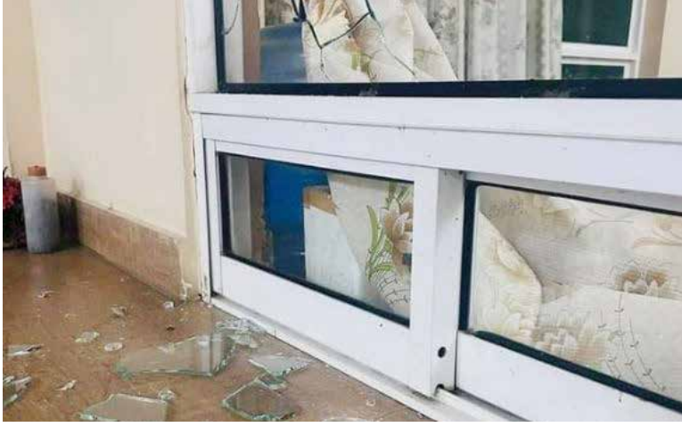
தனது மனைவியை சுட்ட 40 வயதான நபரை அக்கராயன் பொலிஸார் கைது செய்துள்ளனர். (ஐ)

சம்பவம் குறித்து மேலும் அறியவருவதாவது, காயமடைந்த பெண்ணும் காயத்தை ஏற்படுத்தியவரும் காதலித்து திருமணம் செய்து வாழ்ந்து வருகின்றனர். இந்நிலையில், கணவர் மது போதைக்கு அடிமையாகியுள்ளார். இதனால், குடும்பத்தில் அடிக்கடி சண்டைகள் இடம்பெற்றுள்ளன. இவ்வாறே நேற்று சண்டையின் போதே 5 மாத கர்ப்பவதியான தனது மனைவியை இடியன் துப்பாக்கியால் கணவர் சுட்டுக் காயப்படுத்தியுள்ளார். காயமடைந்த பெண் 33 வயதுடையவர் என்பதுடன் 2 பிள்ளைகளின் தாயும் ஆவார். சம்பவத்தில் காயமடைந்த பெண் அக்கராயன் மருத்துவமனையில் சேர்க்கப்பட்டு, மேலதிக சிகிச்சைக்காக கிளிநொச்சி பொது மருத்துவமனைக்கு மாற்றப்பட்டுள்ளார்.