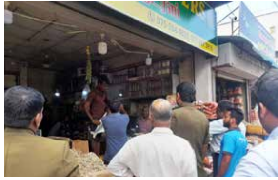
கடைகள் அனைத்தையும் பொலித்தீனால் மூடி தூசுகள் படாதவாறு காட்சிப்படுத்துமாறும் பொது சுகாதார பரிசோதகர்களால் அறிவுறுத்தப்பட்டது. மேற்படி குறைபாடுகள் நிவர்த்தி செய்ய இரண்டு வார கால அவகாசம் வழங்கப்பட்டதுடன் கால அவகாசத்தின் பின்னரும் குறைபாடுகள் நிவர்த்தி செய்யாத வர்த்தகர்களுக்கு எதிராக கடுமையான சட்டநடவடிக்கை எடுக்கப்படும் எனப் பொது சுகாதார பரிசோதகர்களால் தெரிவிக்கப்பட்டது.