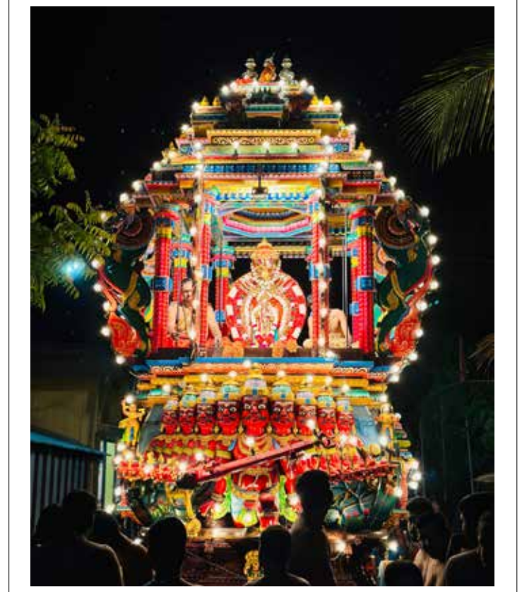
நல்லூர் வடக்கு சந்திரசேகரப் பிள்ளையார் ஆலயத்தின் கையாடல் திருவிழா நேற்று முன்தினம் நடைபெற்றவேளை...!

ஆர்வமுள்ள அனைவரையும் இந்த நிகழ்வில் கலந்து கொள்ளுமாறு தேசிய கலை இலக்கிய பேரவையினர் அழைப்பு விடுக்கின்றனர். (ஐ)