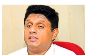
மதாஸ தெரிவித்தார். அவர் மேலும்

கொழும்பு, ஏப். 14 சுதந்திரமான ஊடகம் அற்ற நாட்டில் சர்வதிகார ஆட்சி தலைதூக்கும். அதற்கு ஒருபோதும் நாம் இடமளித்து விடக்கூடாது என எதிர்க்கட்சித் தலைவர் சஜித் பிரே