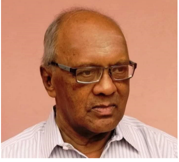
நிந்தவூர், ஏப். 14

தென்கிழக்கிலங்கை செய்தியாளர் சங்கம் அனுதாபம்