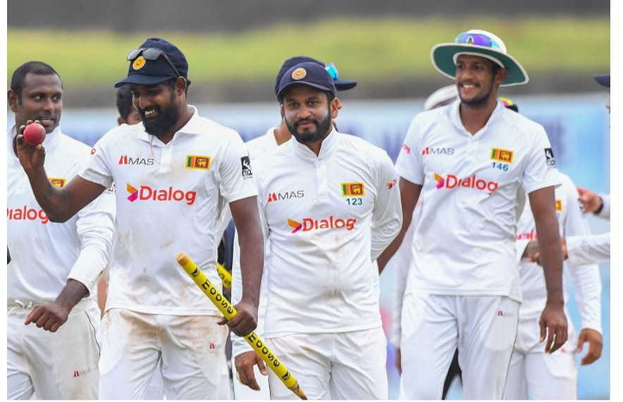
சாமிக்க கருணாரத்ன ஆகியோர் இந்த டெஸ்ட் அணியில் இடம் பிடிக்கவில்லை. மேலும், வேகப்பந்து வீச்சாளர்களான கசன் ராஜித் மற்றும் லஹிரு குமார ஆகியோருக்கும் இந்தப் போட்டியில் இருந்து ஓய்வளிக்கப்பட்டுள்ளது.

எனினும், நிறைவடைந்த நியூசிலாந்து டெஸ்ட் தொடருக்கு பெயரிடப்பட்ட நிரோஷன் டிக்கவெல்ல, ஓஷத பெர்னாண்டோ மற்றும்