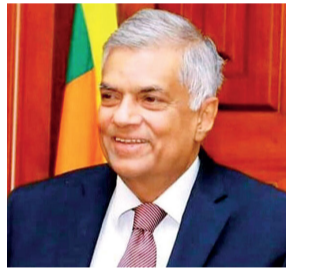
விக்கிரமசிங்க தனது புத்தாண்டு வாழ்த்துச் செய்தியில்

அடுத்த புத்தாண்டில், இதனை விடவும் சௌபாக்கியத்தையும் செழிப்பையும் ஏற்படுத்திக்கொள்வோம் நாம் முயற்சிக்கவேண்டும் என ஜனாதிபதி ரணில்