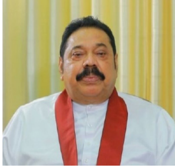
கட்சி அல்ல. மக்கள் ஆணையால் தெரிவு செய்யப்பட்ட அரசும் கூட.

மொட்டு ஆட்சி சர்வாதிகார அரசு இல்லை என்பதை அனைவரும் கவனத்தில்கொள்ள வேண்டும். மக்கள் பக்கம் நின்று நாட்டின் நலன் கருதியே நாம் முடிவு எடுப்போம்-என்றார். (அ)