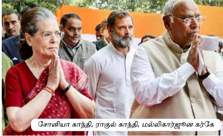
சோனியா காந்தி, ராகுல் காந்தி, மல்லிகார்ஜுன கர்கே