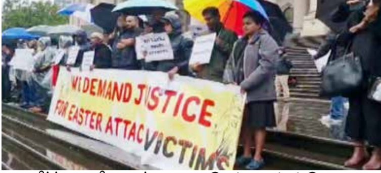
உயிர்த்த ஞாயிறு தாக்குதலில் பாதிக்கப்பட்டவர்களுக்கான அவுஸ்திரேலிய - இலங்கை சங்கம் இதனை ஏற்பாடு செய்திருந்தது. (அ)

உயிர்த்த ஞாயிறு தாக்குதலில் பாதிக்கப்பட்டவர்களுக்கு உடனடியாக நீதி வழங்குமாறும், அதனுடன் தொடர்புடைய அனைத்து தரப்பினருக்கும் எதிராக சட்டத்தை அமுல்படுத்துமாறும் கோரி இந்த ஆர்ப்பாட்டம் முன்னெடுக்கப்பட்டது.