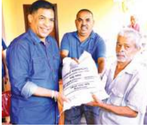
மில்லும் நாம் நலன்புரி நடவடிக்கைகளை கைவிடவில்லை என்றார்.

“அதே நேரம் ஜனாதிபதி ரணில் விக்ரமசிங்க மேற்கொண்ட தியாகம் ஏறலாற்று ரீதியில் முக்கியமானதாகும். பல்வேறு சிரமங்களுக்கு மத்தி