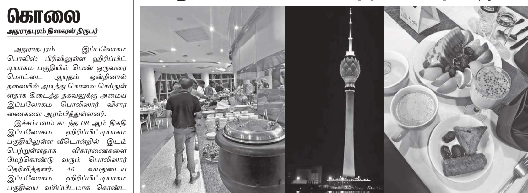
அநூராதபுரம் தினகரன் நிருபர்

அநூராதபுரம் இப்பலோகம பொலிஸ் பிரிவினுள்ள ஹிரிப்பிட்டியாகம பகுதியில் பெண் ஒருவரை மொட்டை ஆயுதம் ஒன்றினால் தலையில் அடித்து கொலை செய்துள்ளதாக கிடைத்த தகவலுக்கு அமைய இப்பலோகம பொலிஸார் விசாரணைகளை ஆரம்பித்துள்ளனர். இச்சம்பவம் கடந்த 08 ஆம் திகதி இப்பலோகம ஹிரிப்பிட்டியாகம பகுதியிலுள்ள வீடொன்றில் இடம்பெற்றுள்ளதாக விசாரணைகளை மேற்கொண்டு வரும் பொலிஸார் தெரிவித்தனர். 46 வயதுடைய இப்பலோகம ஹிரிப்பிட்டியாகம பகுதியை வசிப்பிடமாக கொண்ட பெண் ஒருவரே சம்பவத்தில் உயிரிழந்துள்ளார் என்பது தெரியவந்துள்ளது. சம்பவம் பற்றி மேலும் தெரியவருவதாவது, கணவனும் மனைவியும் சிறிது காலம் தற்காலிகமாக பிரிந்திருந்த நிலையில் நேற்று இச்சம்பவம் இடம்பெற்றுள்ளதாக ஆரம்பகட்ட பொலிஸ் விசாரணைகளில் இருந்து தெரியவந்துள்ளது. கொலைச் சம்பவத்துடன் தொடர்புடைய சந்தேக நபர் பிரதேசத்திலிருந்து தலைமறைவாகியுள்ளார்.