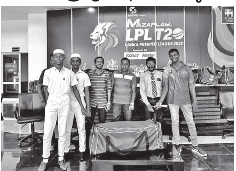
ஹம்பாந்தோட்டை குறுப் நிருபர்