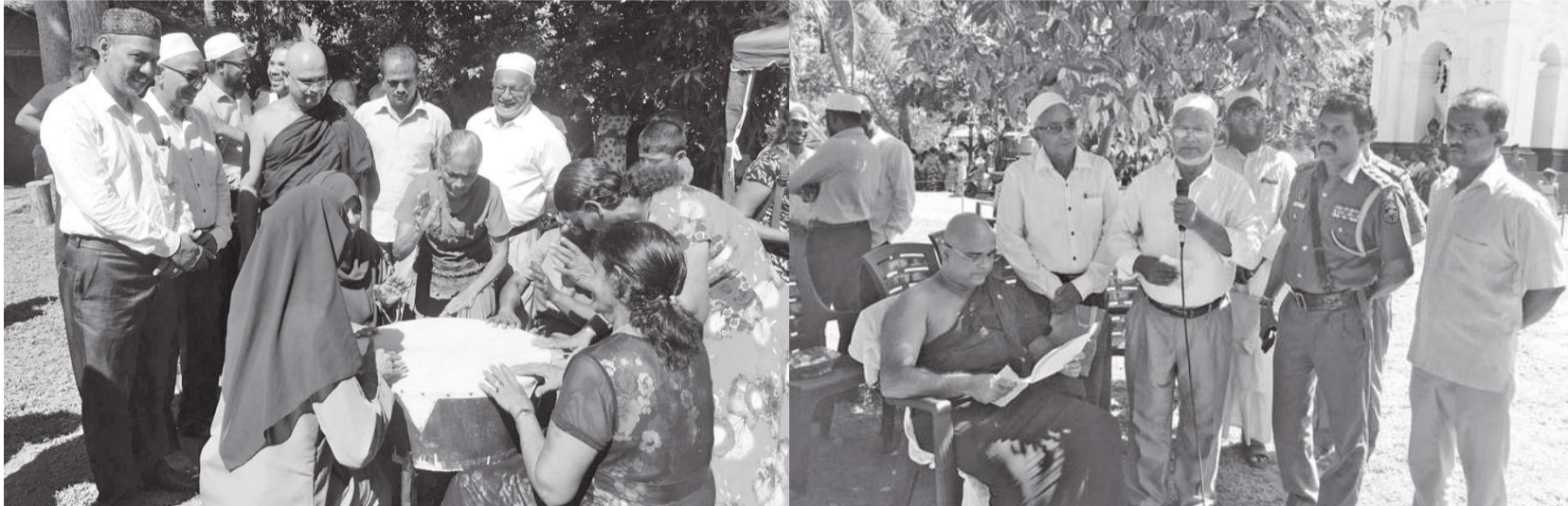
பேருவளை விசேட நிருபர்

பேருவளையில் சிங்கள முஸ்லிம் இன உறவை மேலும் சக்தி பெறச் செய்யும் நோக்குடன் விசேட புத்தாண்டு பாரம்பரிய கலாசார நிகழ்ச்சியொன்று பேருவளை மக்கள் பிரிவன விகாரையில் சிறப்பாக நடைபெற்றது.