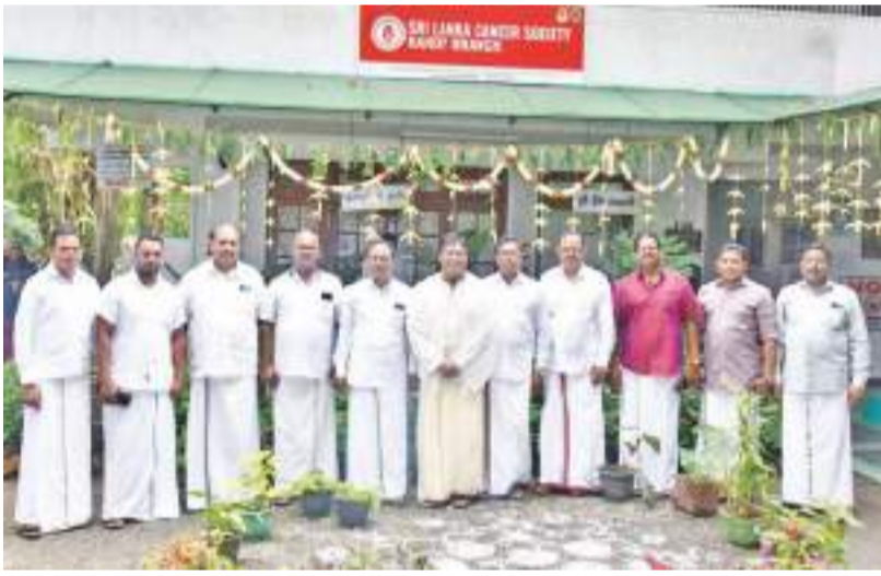
விடயங்களிலும் முழு அளவிலான ஆதரவையும் பங்களிப்பையும் உதவியையும் வழங்கினார்.

? சமூகப் பணிகளில் உயர் பதவிகளை வகித்துக் கொண்டு செயலாற்றிய காலம் தொடர்பில் சில வரிகள்... சிவில், சமூக அமைப்புக்களில் இணைந்து செயற்பட்ட போதிலும் பின்பு பிரபலமான சிவில் அமைப்புக்களுடன் இணைந்து சமூகப் பணிகளில் ஈடுபடத் தொடங்கினேன். அந்த வகையில் முதலில் 2012 ஆம் ஆண்டில் கண்டி இந்து இளைஞர் மன்றத்தில் இணைந்து கொண்டேன். அதே போல்