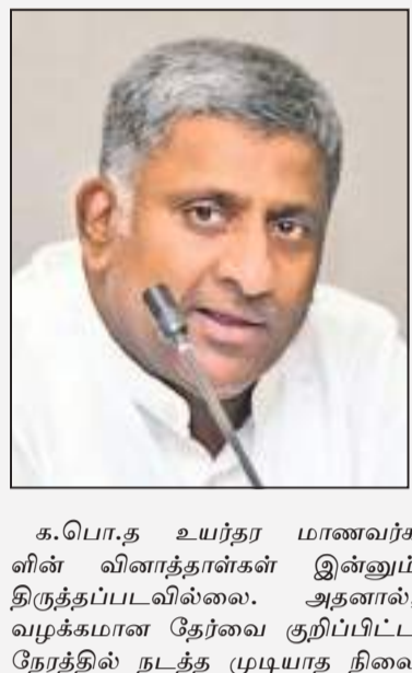
க.பொ.த உயர்தர மாணவர்கள் வினாத்தாள்களை இன்னும் திருத்தப்படவில்லை. அதனால், வழக்கமான தேர்தலை குறிப்பிட்ட நேரத்தில் நடத்த முடியாத நிலை

ஏற்பட்டுள்ளது. தேர்தலைக் கோரி வீதிக்கு வந்து போராட்டம் நடத்துபவர்கள் தங்கள் பிள்ளைகளின் வினாத்தாளைத் திருத்த முன்வர வேண்டுமென்று கோரி எவரும் கிளர்ச்சி செய்யவில்லையென நகர அபிவிருத்தி மற்றும் வீடமைப்பு அமைச்சர் பிரசன்ன ரணதுங்க தெரிவித்துள்ளார். அத்துடன் நாடு எதிர்நோக்கும் பொருளாதார நெருக்கடியை குறுக்கு வழிகளை கடைப்பிடித்து கோஷங்களிலும் வாக்குறுதிகளிலும் மாட்டிக்கொள்வதன் மூலம் தீர்க்க முடியாதென்றும் அமைச்சர் பிரசன்ன ரணதுங்க தெரிவித்துள்ளார். எனவே, வலி நிவாரணிகள் நோயாளியை தற்காலிகமாக குணப்படுத்தும் அதேவேளை, அடிப்படை நோய்க்கு சிகிச்சையளிப்பதும் அவசியமானதென அவர்