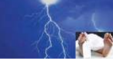
ருவன்வெல்ல பகுதியில் மின்னல் தாக்கியதில் 12 வயது சிறுவன் உயிரிழந்துள்ளதடன் மேலும் இரண்டு சிறுவர்கள் வைத்தியசாலையில் அனுமதிக்கப்பட்டுள்ளனர்.

ருவன்வெல்ல மாப்பிட்டிகம பிரதேசத்தில் களனி ஆற்றில் குளித்துவிட்டு வீட்டிற்கு நடந்து சென்றபோதே இந்த அனர்த்தத்தை சந்தித்துள்ளதாக பொலிஸார் தெரிவித்தனர். காயமடைந்தவர்கள் அவசிய வளை வைத்தியசாலையில் அனுமதிக்கப்பட்டதுடன், மின்னல் தாக்கி ருவன்வெல்ல பிரதேசத்தைச் சேர்ந்த சிறுவன் ஒருவரே உயிரிழந்துள்ளார்.