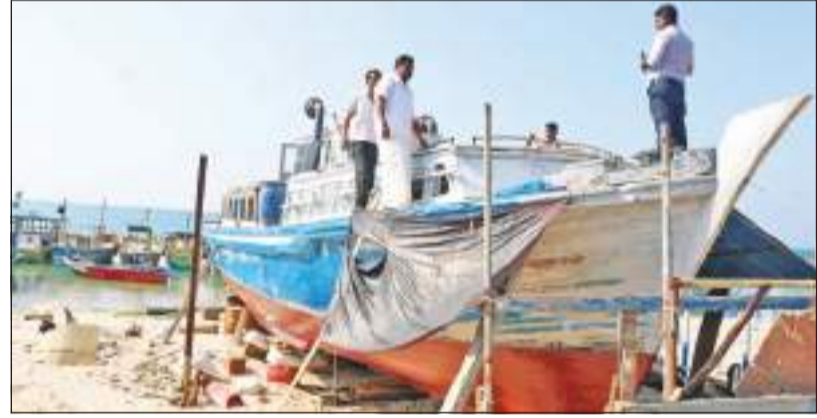
பரந்தன் குறுப் நிருபர்

யாழ்ப்பாணம் வல்வெட்டித்துறை பகுதியில் திருத்தப்பணிகள் மேற்கொள்ளப்பட்டு வரும் குமுதினி படகினை பாராளுமன்ற உறுப்பினர் சிவஞானம் சிறிதரன் சென்று பார்வையிட்டார்.