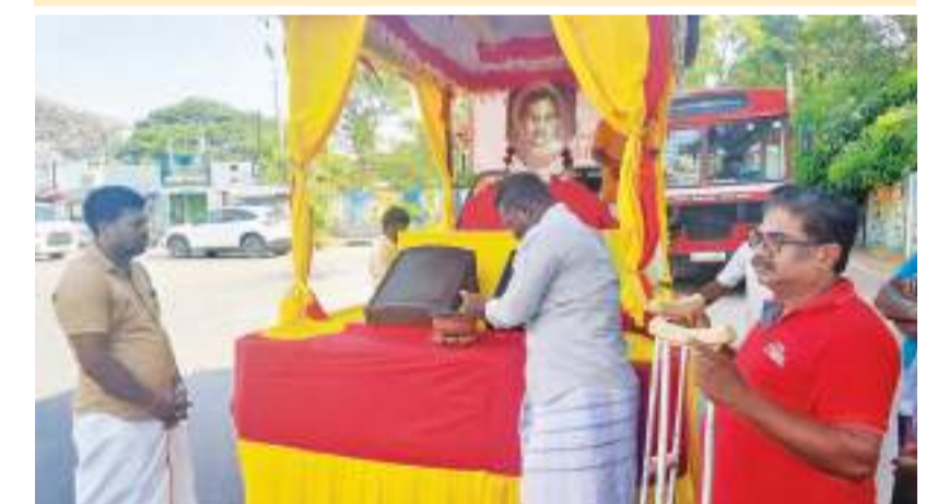
சாவகச்சேரி விசேட நிருபர்