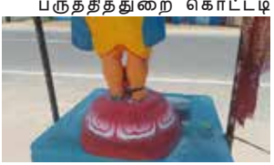
பிள்ளையார் ஆலயத்தின் முகப்பில் உள்ள பிள்ளையார் சிலை உண்டியலுடன் காணப்படுகிறது.

யாழ்ப்பாணம், பருத்தித்துறை கொட்டடி பிள்ளையார் கோயில் ஆலயத்தின் பிள்ளையார் சிலை காதையர்களால் உடைத்து எடுத்துச் செல்வதற்கு எடுத்த முயற்சி தோல்வியடைந்துள்ளதாக அந்தப் பகுதி மக்கள் தெரிவித்துள்ளனர்.