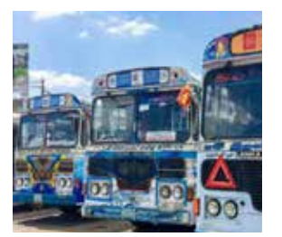
அனைத்து பஸ் உரிமையாளர்களும் மே 31 ஆம் திகதிக்கு முன்னர் தேவையான மாற்றங்களைச் செய்ய அறிவுறுத்தப்பட்டுள்ளனர். - என்றார்.

சொகுசு பஸ்கள் சேவையில் ஈடுபட்டுள்ளன. தற்போது அரை சொகுசு பஸ்களின் உரிமை யாளர்களுக்கு தங்கள் பஸ்களை சாதாரண பஸ்களாக அல்லது சொகுசு பஸ்களாக மாற்றுவது அறிவுறுத்தப்பட்டுள்ளது. மேலும் இலங்கை போக்குவரத்து சபைக்குச் சொந்தமான அரை சொகுசு பஸ்களையும் சாதாரண சேவைகளாக அல்லது சொகுசு சேவைகளாக மாற்றிக் கொள்ள அறிவுறுத்தப்பட்டுள்ளது. அரை சொகுசு பஸ்களை பொது சேவை அல்லது சொகுசு சேவையாக மாற்ற விரும்பும்