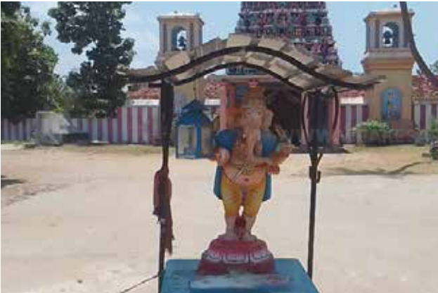
இந்நிலையில் சம்பவதீனம் காலை அடியவர் ஒருவர் குறித்த சிலையை வழிபட்ட போது பிள்ளையார் சிலையின் கால் பகுதி உடைக்கப்பட்டிருப்பதை அவ தானித்துள்ளார்.