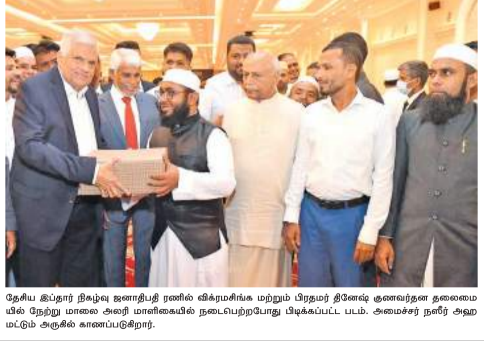
தேசிய இயந்திர நிகழ்வு ஜனாதிபதி ரணில் விக்கிரமசிங்க மற்றும் பிரதமர் திணைக் குணவர்தன தலைமையில் நேற்று மாலை அவரி மாளிகையில் நடைபெற்றபோது பிடிக்கப்பட்ட படம். அமைச்சர் நளீர் அஹமட் மட்டுமே அருகில் காணப்படுகிறார்.