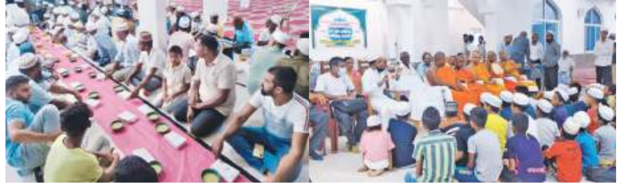
இனங்களுக்கிடையே சமாதானத்தையும் புரிந்துணர்வையும் ஏற்படுத்தும் நோக்கில் ஏலமல் பொத ஜம்மா பள்ளிவாசல் நிர்வாக சபையினால் ஏற்பாடு செய்யப்பட்ட நோன்பு திறக்கும் இப்தார் நிகழ்வில் பொத பாலரும் கலந்து கொண்டதை படத்தில் காணலாம்.