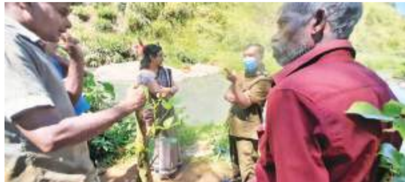
மாசடைந்து மீன்கள் இறந்திருக்கக் கூடும் என சந்தேகம் தெரிவிக்கப் பட்டுள்ளது. அத்துடன் ஆகரஓயா ஆற்றில் ஓடும் நீரினை அக்கரகந்த

ஆகரஓயா ஆற்றில் மீன்கள் இறந்து மிதந்ததற்கான காரணத்தை கண்டறிய களத்திற்கு விஜயத்தை மேற்கொண்ட சுகாதார அதிகாரிகள் ஆற்றில் இறந்து மிதந்த மீன்களையும் ஆற்று நீரில் மாதிரிகளை பெற்று பேராதனை நீர் மாதிரி பரிசோதனை ஆய்வு கூடத்திற்கு அனுப்பி வைத்துள்ளனர். அத்தோடு அக்கரப்பத்தனை ஹோல்புக்கு பகுதியில் இயங்கும் தேயிலை தொழிற்சாலையில் இருந்து வெளியான கழிவு ஆற்று நீரில் கலக்கப்பட்டு ஆற்று நீர்